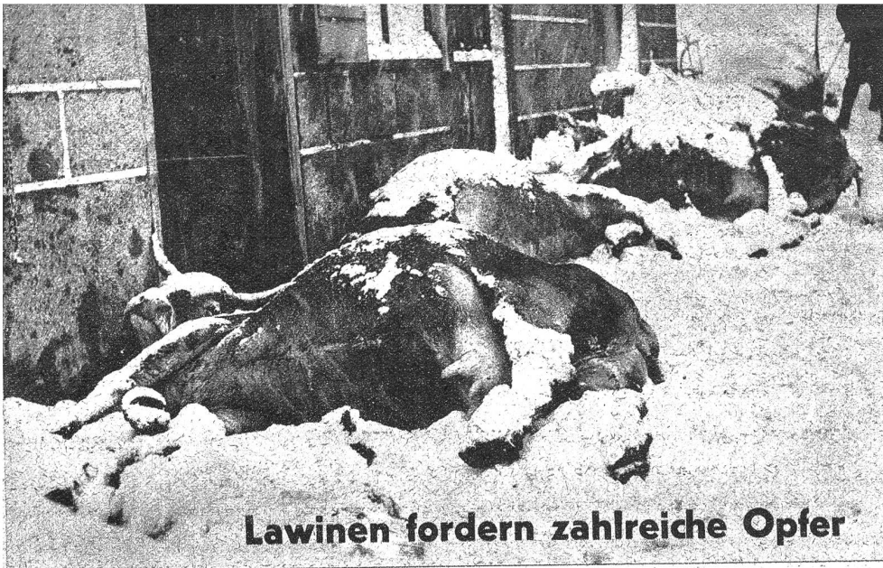
Lawinen fordern zahlreiche Opfer