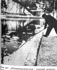
Eine zur „Schneeliquidierung“ speziell erbaute Schneemauer ermöglicht ein rasches Abrutschen der Schneemassen in das Wasser