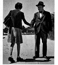
Auf dem Schulweg und auf ihren Gängen durch die Strassen grüssen die Schüler alle bekannten Leute. Links: Sie tragen der Nachbarin das Marktzeck nach Hause, ziehen den schwerbeladenen Wagen den Rain hinauf, begleiten einen ortsunkundigen Fremden auf den Bahnhof, erweisen ihren Gefährten allerlei Freundschaftsdienste und teilen mit ihnen das Pausenbrot. Sie hüten sich, Wickelspinnere einfach auf die Strasse zu werfen, vielmehr tragen sie solche Abfälle zum nächsten Kehrichteimer.

Falls die Aktion in Grenchen gelingt, wird sie wahrscheinlich auch anderswo, vielleicht sogar als eidgenössische Angelegenheit durchgeführt.