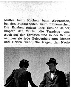
Auf dem Schulweg und auf ihren Gängen durch die Strassen grüssen die Schüler alle bekannten Leute Links: Sie tragen der Nachbarin das Marktnetz nach Hause, ziehen den schwerbeladenen Wagen den Rain hinauf, begleiten einen ortsunkundigen Fremden auf den Bahnhof, erweisen ihren Gefährten allerlei Freundschaftsdienste und teilen mit ihnen das Pausenbrot. Sie hüten sich, Wickelspinnere einfach auf die Strasse zu werfen, vielmehr tragen sie solche Abfälle zum nächsten Kehrichteimer.