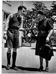
barin das Marktnetz nach Hause, ziehen den schwerbeladenen Wagen den Rain hinauf, begleiten einen ortsunkundigen Fremden auf den Bahnhof, erweisen ihren Gefährten allerlei Freundschaftsdienste und teilen mit ihnen das Pausenbrot. Sie hüten sich, Wickelspinnere einfach auf die Strasse zu werfen, vielmehr tragen sie solche Abfälle zum nächsten Kehrichteimer. Falls die Aktion in Grenchen gelingt, wird sie wahrscheinlich auch anderswo, vielleicht sogar als eidgenössische Angelegenheit durchgeführt.

Das Schwerste, aber zugleich das Wichtigste ist das Dienen. Es gilt, immer Gutes zu tun und Hand anzulegen, wo immer sich Gelegenheit bietet. Restlose Hilfsbereitschaft, gezeigt sich vor allem gegenüber den Eltern. Unaufgefordert nehmen die Kinder der Mutter alle Arbeiten ab, die sie selber erledigen können. Sie bemühen sich um ihre kleinen Geschwister, besorgen die Einkäufe, schaffen überall Ordnung. Die älteren Mädchen helfen der