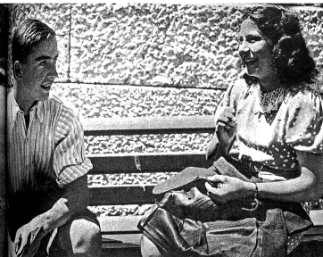
Links aussen: Sie ziehen den schwerbeladenen Karren des Handwerkers den Rain hinauf... Mitte: Die Kinder hüten sich, Wickelspinnere oder Obstreste einfach auf die Strasse zu werfen, vielmehr tragen sie solche Abfälle zum nächsten Kehrichteimer. Wenn sie auf dem Schulhausplatz usw. Unrat erblickten, heben sie diesen ungeheissen auf Links: Sie verlangen von der Frau Abward Faden und Nadel, um einem Mitschüler einen Knopf am Rock anzubringen