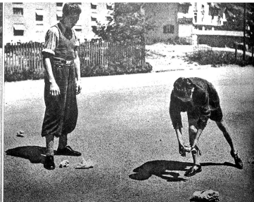
Eine Aktion der Schule in Grenchen, mit der Losung „Grüssen, denken, dienen.“