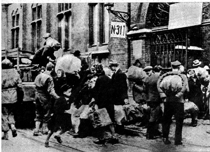
„Fremdarbeiter“ wurden bisher diese Polen genannt, die in Brüssel unter dem Kommando der Deutschen für deren Kriegsproduktion arbeiten mussten, nachdem sie aus ihrer Heimat „versetzt“ worden waren. Jetzt beziehen diese bisher in Lager untergebrachten Polen erstmals wieder Wohnungen

Niemand wird glauben, dass «Port Winston» und vermutlich auch der eine oder andere ähnliche Hafen, oder Einrichtungen, die in zerstörten Hafenstädten improvisiert wurden, während der letzten Wochen ausser Betrieb gesetzt worden seien. Im Gegenteil: Die lange vorher bedachte und vorbereitete Organisation umfasst ausser den Landeplätzen zweifellos auch die zerstörten Strassen, Brücken und Schienenwege, die Stellwerke und Aufnahmegebäude zahlloser Bahnhöfe im befreiten Frankreich und in Belgien. Und ehe die alliierten Verantwortlichen wissen, dass die Nachschübe auf allen Linien ungehemmt anrollen und die Stapel dicht hinter der Front jedem Verbrauch standhalten werden, kommt es zu keiner neuen Grossoffensive. Das Beispiel, das soeben die Russen in Ost-