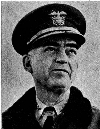
Die japanische Kriegsmarine hat in der Seeschlacht bei den Philippinen, der grössten Seeschlacht des ganzen zweiten Weltkrieges, die vernichtendste Niederlage erlitten. Admiral Thomas C. Kinkaid, verteilte den Plan der Japaner, welche die Invasions-Armada Amerikas vernichten wollten