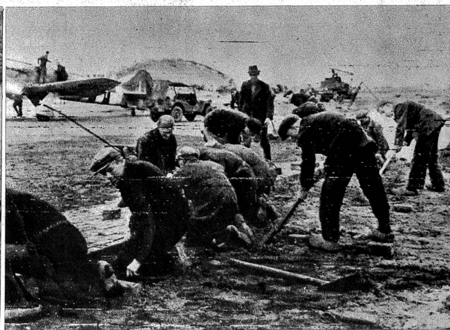
Mit Begeisterung stellen sich die holländischen Arbeiter den Alliierten zur Mithilfe zur Verfügung, wo immer man ihrer bedarf. So helfen Angestellte und Arbeiter unermüdet an der Ausbesserung der zuvor von den Alliierten selbst schwer bombardierten Flugplätze.

Wer wusste bis in die jüngsten Tage etwas von «Port Winston», jenem künstlichen Hafen an der Calvados-Küste nördlich von Bayeux ? Nach Winston Churchills Ideen gebaute Riesencaissons aus Stahl, die man an Ort und Stelle mit Beton füllte und in Verbindung mit alten Kriegsschiffen zur Improvisierung einer Hafentmole verwandte, in gleicher Weise errichtete künstliche Wellenbrecher, Ausladerampen und alles, was sonst ein «natürlicher Hafen» schon besitzt oder wozu er die Baufundamente bietet — das ist «Port Winston». Dieser direkt übers Meer antransportierte Hafen erklärt uns heute das Geheimnis der ra-