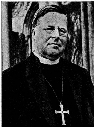
In London ist unerwartet der Erzbischof von Canterbury, Dr. William Temple, gestorben. Er war einer der Führer der jungen Schule auf kirchlichem wie auf sozialem Gebiete. Seine Amtseinstellung als Nachfolger des damals zurückgetretenen Dr. Lang erfolgte am 24. April 1942

piden alliierten Ausladungen an der normannischen Küste. Man konnte sich seinerzeit gar kein Bild machen über die Wege und Landungsorte für mehr als zwanzig Divisionen samt ihrem Material, welche nachweisbar schon vor dem Falle Cherbourgs den Deutschen gegenüberstanden. Mit dem Namen «Port Winston», den die Soldaten aus dem Stegreif erfanden, verbindet sich also eines der Geheimnisse, welchem Eisenhower und Montgomery den Erfolg dieses Sommers verdanken.