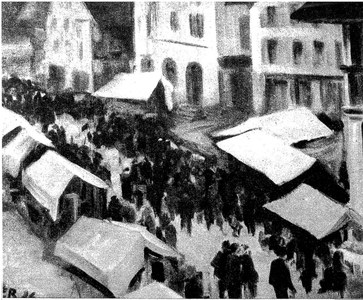
„Loupemärit“, Original von E. Ruprecht

kehr wieder erschlossen worden. Gewerbe und Handel haben sich gehoben und die Industrie hat Einzug gehalten. Wohlstand verbreitete sich, und das Sensetal ist heute ein Gebiet, aus welchem der Staat Bern beträchtliche Steuereinkünfte bezieht.