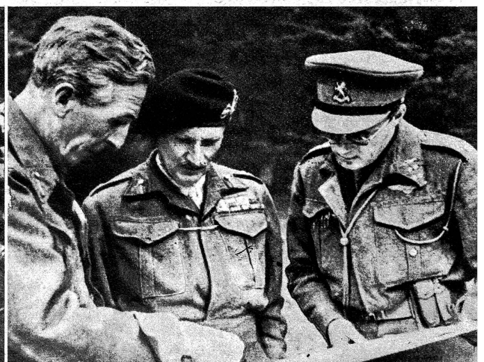
Prinz Bernhard der Niederlande, der Kommandant der niederländischen innern Streitkräfte, ist an der Grenze seines Landes im englischen Hauptquartier eingetroffen