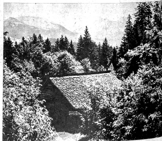
Die Landschaft liegt vor dem Wanderer wie ein schönes Bilderbuch, in dem sich immer neue Saiten öffnen. Blick von der Hohfluh auf das Wetterhorn

dunklen Zacken der Engelhörner, das Dossenhorn und Berglistock und viele andere mehr, von denen der Haslibergwanderer nachher immer wieder träumt und schwärmt. Jeder Schritt auf der Strasse vom Brüning bis nach Wasserwendi hinauf oder nach Reuti hinunter, ist ein Rastplatz für einen Blick in die weite Landschaft, sei es auf die Gipfel der Alpen, den Taleinschnitt zur Grimsel oder zum Brienzensee hinunter.