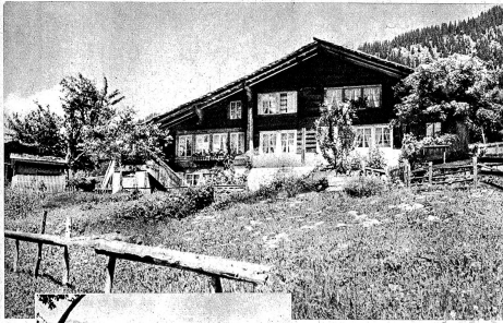
Ein richtiges Hasliberg-Heimat Links: Ein Bauer vom Hasliberg