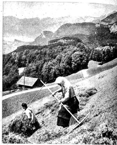
Blick gegen den Brienzensee und die Brienzerrothornkette