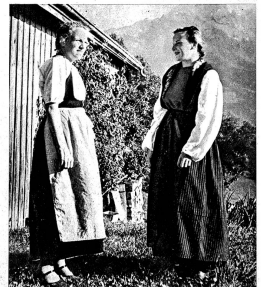
Zwei Haslibergerinnen, die eine in der Werktags-, die andere in der Sonntagsfracht des Tales