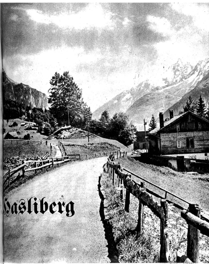
Eine malerische Partie an der Haslibergstrasse

Am sonnigen Berghang über den hohen Felswänden rechts der Aare liegt der Hasliberg. Kleinere Alpendörfer wie Hohfluh, Wasserwendi, Reuti liegen auf dieser breiten Bergterrasse, und wer sie durchwandert, genießt fortwährend eine prachtvolle Aussicht. Immer wieder ist das Auge entzückt von neuen landschaftlichen Reizen: in der Ferne schimmert der Spiegel des Brienzesees, weit draussen im Westen, und tief unter der Bergterrasse zieht sich das Aaretal mit seinen Strassen und Häusern friedlich dahin. Mit zum Schönsten aber gehören die Bergkanten der Wetterhörner, der herrliche Rosenlaugletscher, die