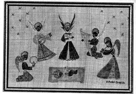
Himmliche Musik. Bildstickerei auf Rohseide