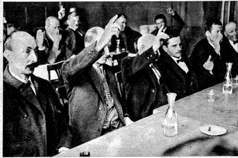
Auch in der Berggemeindeversammlung wird nach schweizerischer demokratischer Art über jede Vorlage abgestimmt