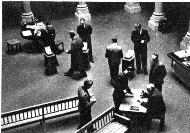
Wahltag – Festtag der Demokratie