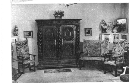
Ein schöner Schrank, Frühbarock, stammt aus dem Stift Beromünster. Zur Seite: Ameublement Louis XIII., Nussbaum geschliffen mit echten Tapissereien aus dem 17. Jahrh., französisch - Rechts: Esszimmerensemble Renaissance-Zeit, schweizerisch. Darüber: Stiche von Merion, links Pietà, Tirol, 16. Jahrh.