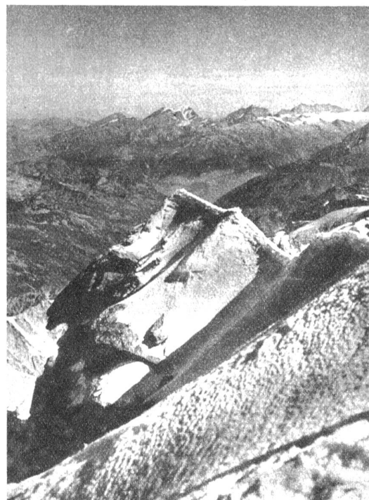
Der oberste Teil des Weisshorn-Nordgrates und Blick auf die Berner Alpen

ihnen auch die Nebel verzogen und die Berge strahlten im hellsten Sonnenglanze. Zwar pfiiff ein recht scharfer Wind um die Grate, so dass wir uns auf dem Gipfel ganz gerne an einen geschützten Ort verzogen. Dennoch beeilten wir uns nicht besonders und genossen zunächst die prachtvolle, weite Sicht ins Herz des Walliser Hochgebirges in vollen Zügen, um dann gemächlich die vielen Türme zum Nadelhorn und