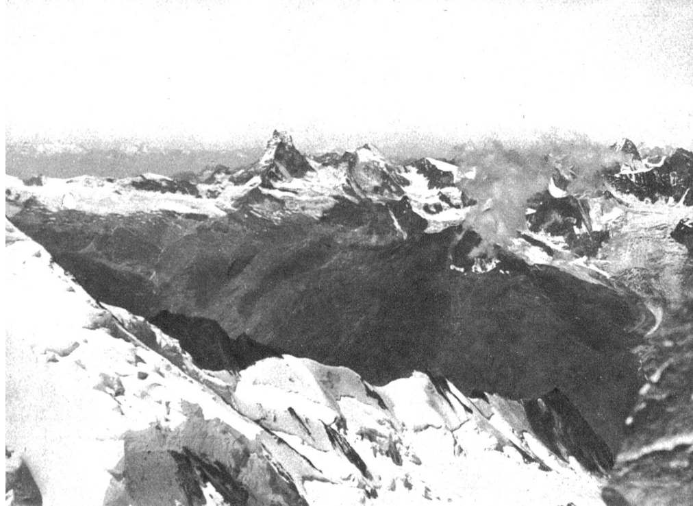
Im Aufstieg zum Täschhorn: Blick auf das Matterhorn und die Bergwelt von Zermatt

weiter bis zum Hohbergjoch zu überklettern.