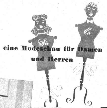
eine Modeschau für Damen und Herren