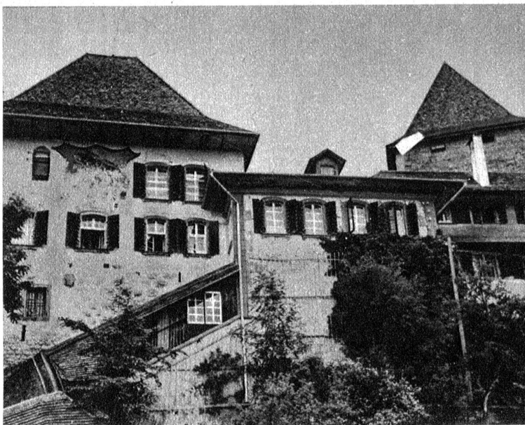
Die weisse Fahne auf der Zwangserziehungsanstalt

Seit vielen Jahren weht zur Zeit erstmals wieder auf Schloss Trachselwald die weisse Fahne. Sie besagt, dass sämtliche „Räume“ der Zwangserziehungsanstalt zur Zeit leer sind. Hoffentlich kann sich die weisse Fahne noch recht lange auf dem stolzen Schloss, dem eine so schwierige Mission überbunden wurde, behaupten