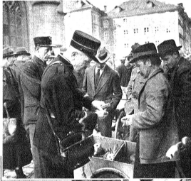
Unten: „Wi viel gisch mir für die Håse!“