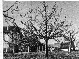
Beispiel eines gepflegten Obstgartens. Solche Bäume bringen Nutzen.