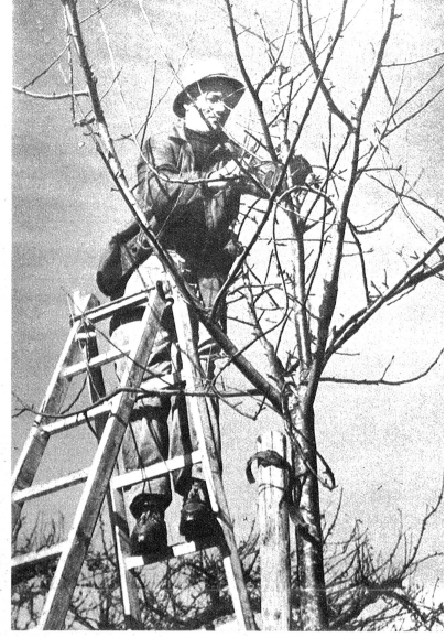
Ein Baumwärtter an der Arbeit. Vor allem handelt es sich um fachgemässes Schneiden der Bäume, ein Gebiet, in welchem die letzten Jahre erfreuliche Fortschritte gebracht haben.