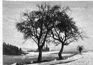
So soll es nicht sein. Diese Obstbäume schaden dem Landwirt, mehr als sie nützen und werden entfernt.