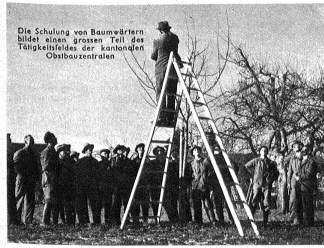
Die Schulung von Baumwärttern bildet einen grossen Teil des Tätigkeitsfeldes der kantonalen Obstbauzentralen.