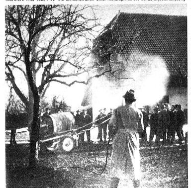
Landwirte werden über alle Fragen des Obstbaus an Hand von praktischen Beispielen instruiert. Hier sehen wir die Demonstration einer Motorspritze zur Schädlingsbekämpfung.