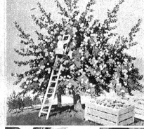
Das neue Plakat des Schweiz. Obstbauverbandes, das die Bevölkerung zu Stadt und Land an ein Gebot der Stunde mahnt: mehr Obst durch Baumpflege.