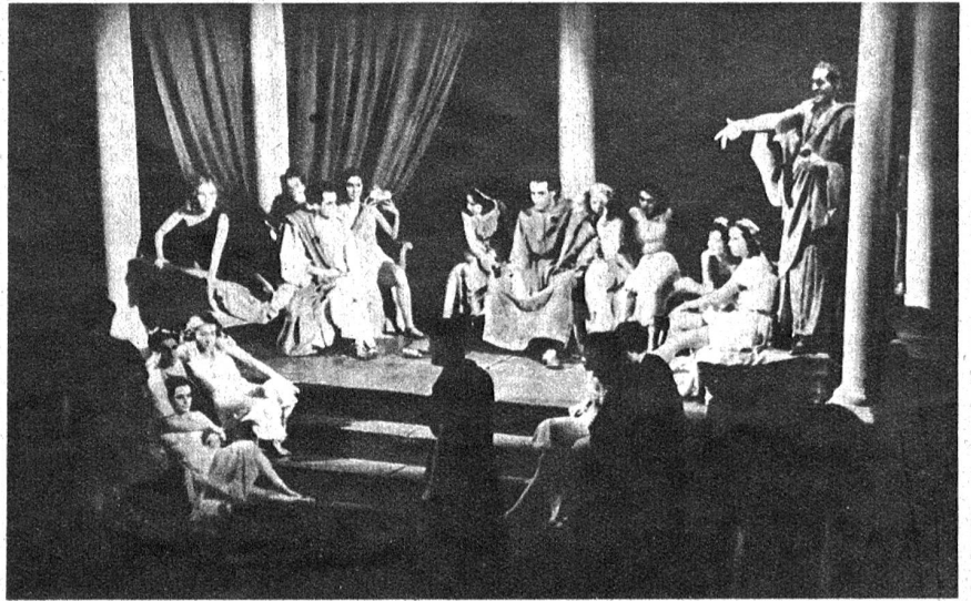
Szene aus dem 6. Bild: Adam als Sergiolus und Eva als Julia genießen die Freuden des Lebens, bis ein vorbeischießender Leichenzug ihnen die Nähe des Todes vor Augen führt

Im Laufe des Januars sind in allen Heereseinheiten Tausende von Militärskifahrern zu den Ausschreibungen für Adelboden angetreten. Nur den Besten ist es vergönnt, sich dort dem Starter zu stellen. Heute steht schon fest, dass die zweiten Ski-Armee-Meisterschaften in Adelboden einen Höhepunkt und einen Markstein in der Entwicklung des Militärskifahrens zugleich darstellen werden. Was unsere Armee braucht, das sind nicht einige besonders gute, schnelle, zähe und ausdauernde Skifahrer, sondern ein Heer von hart trainierten und leistungsfähigen Gebirgs-Skifahrern, die jederzeit imstande sind, ihren Mann zu stellen. Walter Lutz.