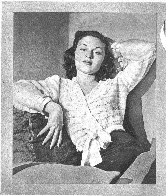
Abb. I. Bettjäckchen. Grösse I. Material: Etwa 400 g Wolle, Stricknadeln und Häkelnadel Nr. 3, Seidenband. Arbeitsweise: Alle Teile des Bettjäckchens nach der Schnittübersicht Ia stricken. Man beginnt die beiden Vorderteile am unteren Rande mit je 82 M. (Maschen), den Rücken mit 84 M. und die Aermel mit je 64 M. (wenn 2 M. 1 cm ergeben). Für das Querstreifenmuster 8 Reihen hin- und zurückgehend rechts, hierauf 1 Reihe abwechselnd 1 M. rechts und 4 Umschläge, dann 1 Reihe rechts, dabei die Umschläge fallen lassen, so dass die M. langgezogen wird, vom Anfang an stets wie-