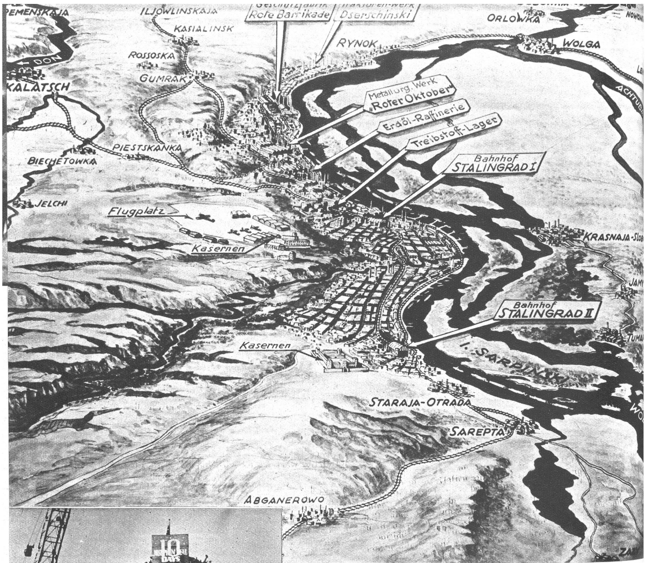
Die „sterbende Stadt“ Stalingrad. Unsere Reliefskizze veranschaulicht die entlang der Wolga angelegte Industriestadt, die nunmehr seit zwei Monaten umkämpft ist und zum Massengrab tausender von Soldaten beider Seiten wurde. Die „sterbende Stadt“, wie Stalingrad von den Russen selbst genannt wurde, hat das gesamte Kriegsgeschehen der letzten Wochen beeinflusst. Links oben Kalatsch, dessen Fall dieser Tage gemeldet wurde