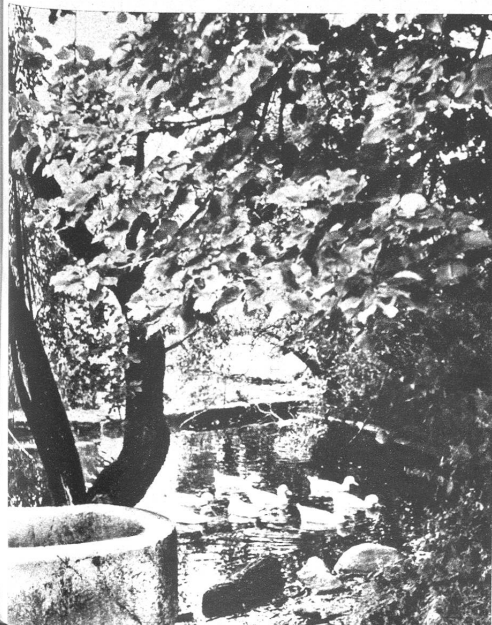
Links: Ententeich beim Pächterhaus