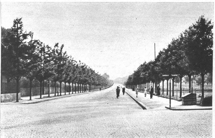
Die neue Schloßstrasse