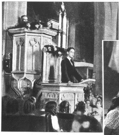
Links: Der Gymnasiast hält seine Ansprache in der Kirche