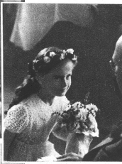
Oben: Der Solennitätspfeffig wird von den Mädchen mit einem anmüßigen Knick, dem «Servantell», in Empfang genommen; der feierlichste Augenblick für die Kinder. — Links: Mädchen mit Blumenbogen im Nachmittagszug