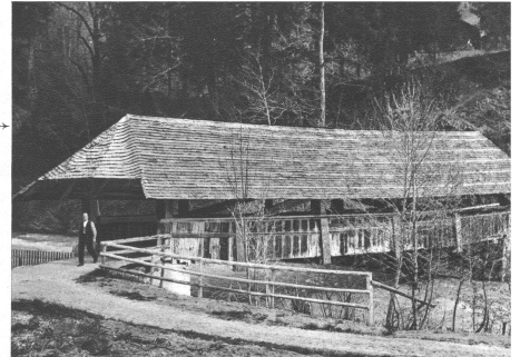
→ Eine Holzbrücke über die Simme. Wie schmeckt das neue, gegen die Mitte leicht geneigte Schindeldach vor dem Spüherstwald daliegt!