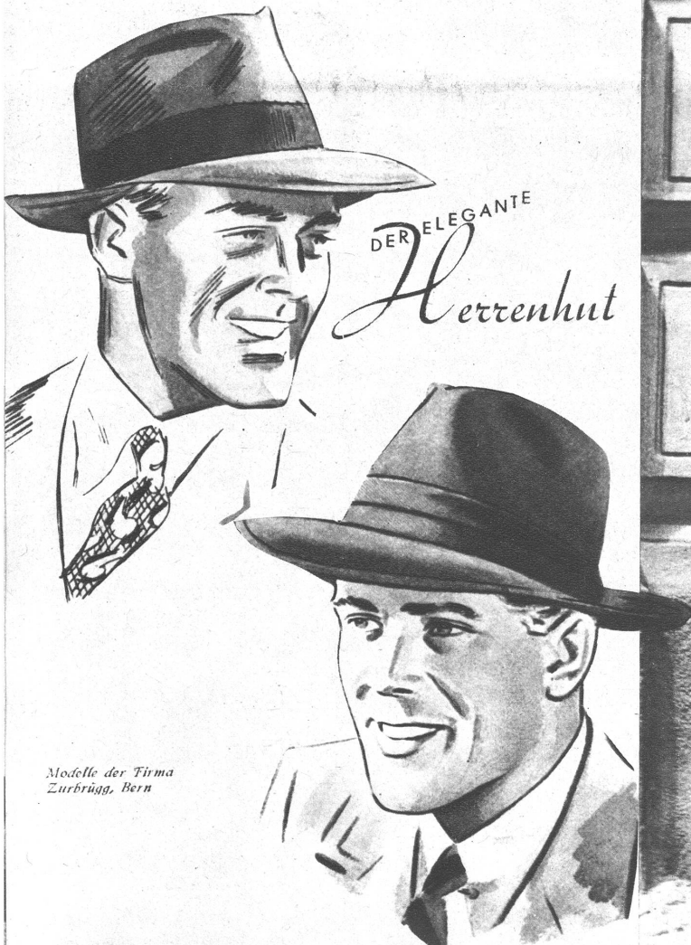
Modelle der Firma Zurbrugg, Bern