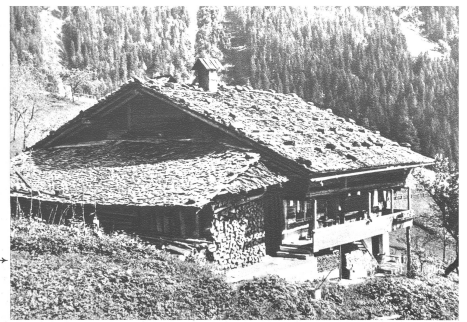
→ Das steinbeschwerte Satteldach eines Habkern-Hauses in seiner malerischen Schönheit. Selbst die beiden Kamine tragen hölzerne Dächlein