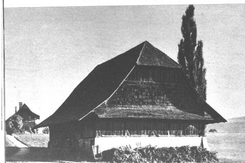
← Die Scheune im Wyssloch in Bern von 1605 mit ihrem stolzen Ziegeldach, mit der verschiedenen Wetterwand und dem schmalen „Klebbüchlein“

Haben Sie schon einmal in einem schönen Alpenort die neu entstandenen Blechdächer bewundert? Nicht wahr, das ist schön, ein hellglänzendes Wellblechdach auf einem sammetbraunen Holzschweicherchen oder auf einem uralten breiten Oberländerhaus. Nicht im Ernst, schön ist das nicht, sondern die Faustschlag ins Gesicht jedes Heimatfreundes der Ausdruck der Missachtung unseres vollen Besitzes an schönen alten Bauten, die Hohn gegenüber der herrlichen Bergwelt, die die hinein unsere Vorfahren so wunderbar zu bauen verstanden. Aber haben Sie schon einmal darauf geachtet, wie schön landesüblich schimmernde Schindeldächer auf den Oberemmentalern das steinbeschwerte Dach des uralten Habkernhauses, ein tief verschaltes Dach einer Sennhütte, oder das Riesendach