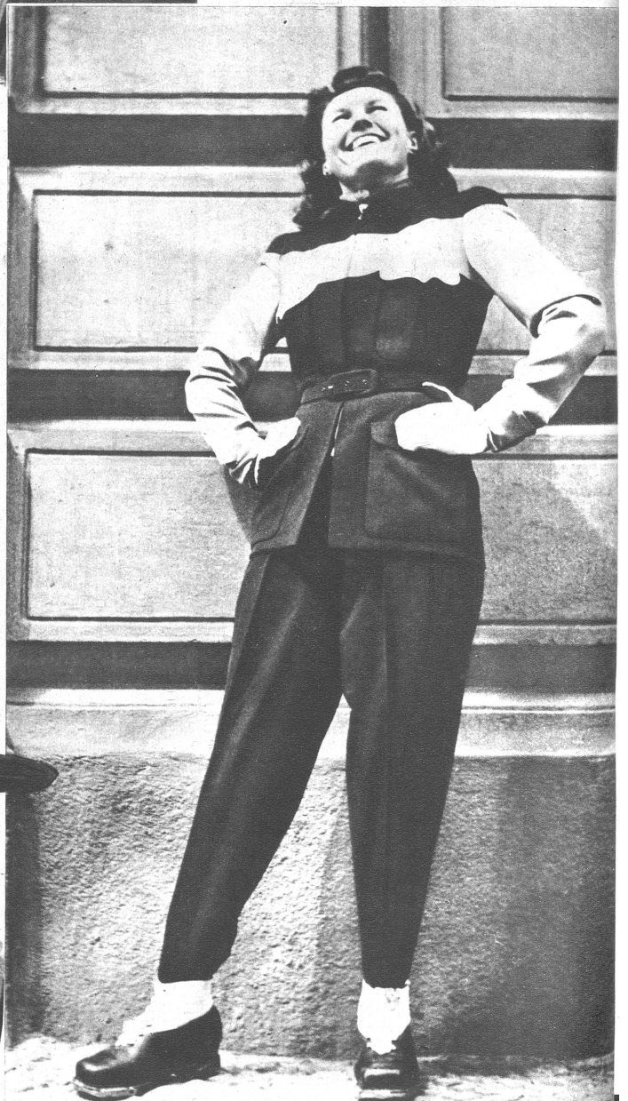
Unten: Eleganter Skianzug, bestehend aus schwarzer Keilhose und einer gelb-schwarzen Skijacke