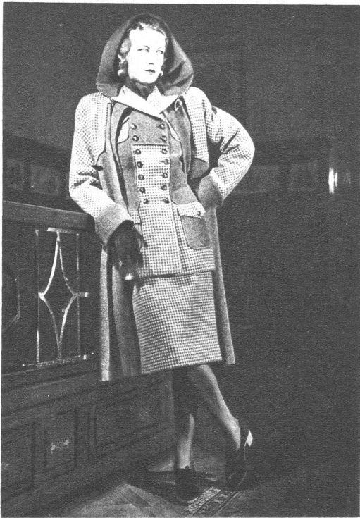
3 teiliger Anzug aus grauem und grau-weiss kariertem Stoff mit doppelreihiger Jacke, dazu ein Terrakotta gefütterter Kapuzenmantel