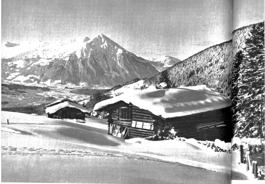
Wintermorgen auf sonniger Höhe.

Vorsäss in der Waldmalte. Wildspuren deuten das wenige Leben an, das hier noch herrscht.