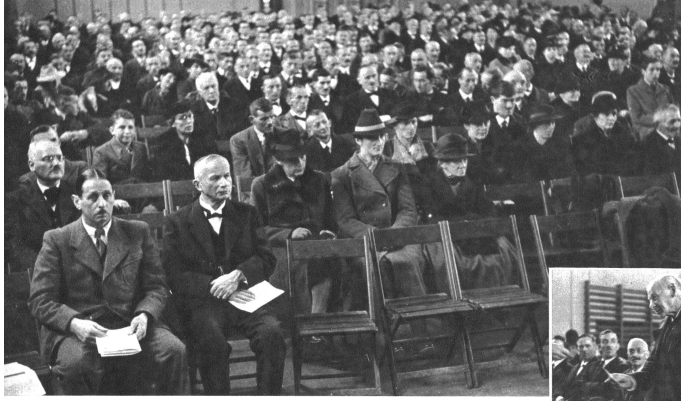
Ueber 500 Personen, Dienstleute und Meisterleute haben sich in der Turnhalle auf dem Gateg in Burgdorf zu einer schlichten, aber verdienten Feier eingefunden