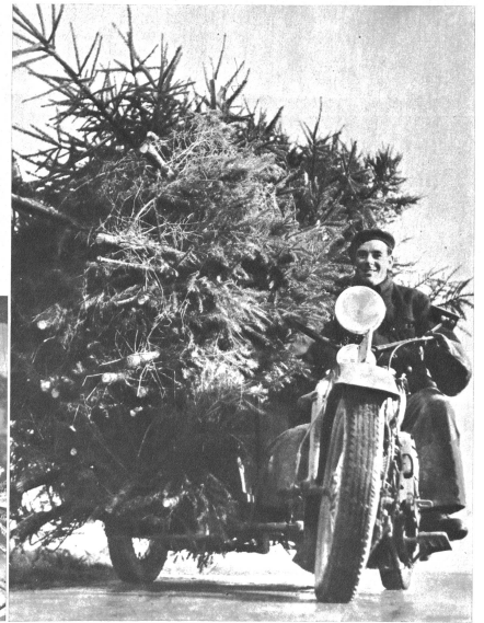
Motorisierter Weihnachtsmann möchte man sagen beim Anblick dieser seltamen Frucht

der Stadt am liebsten haben. Einige kräftige Schnitte mit der besten Exemplare geknickt, abgestutzt, tot am Boden liegen. Der Förster liest mir meine Frage aus den Augen und beschwichtigt: „Nei, mei, nume kei Angst, da Wald schritzt us, das hie ick e Christbaum-Kultur“. Also vorgesortiert, kilometerlang zieht sich ein dunkelgrüner Streifen dem Wald entlang, alles junge Tännchen. Sonst wäre es nie möglich, jedes Jahr mehrere Tausend Stück auszurufen, um sie in der Stadt zu verkaufen. Unser Handwerker hat bald ein ganzes Fuder voll geschnittenen Bäume am Aufladen. Lustig ist es zu sehen, wie er mit dem hoch beladenen Seitenwagen vorsichtig der Stadt zu pendelt, um seine seltene Frucht ohne Zwischenfall heimzubringen. Dort angelangt, beginnt die Arbeit eigentlich erst. Das Christbäumchen braucht auch einen Fuss, um auf dem Weissenhofplatz richtig stehen zu können. Assete werden, wenn nötig, um dem Baum ein gefälliges Aussehen zu verleihen. Die Jahr wollen wir daran denken, wenn wir an einem solchen Dezemberabend verheissungsvoll ein Tännli heimbringen und unsere Kinder in der heiligen Nacht bei Kerzenlicht am Weihnachtsbaum die Lichter brennen lassen.