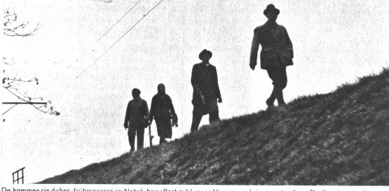
Da kommen sie daher, frühmorgens im Nebel, bewaffnet mit langen Messern und einem guten Auge für die schönsten Bäume