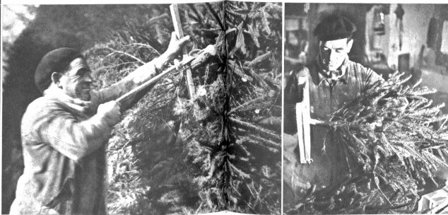
Gut gebunden ist halb geladen

Jedes Jahr wiederholt es sich neu: erst merken wir kaum, dass es Weihnachten zugeht. Blatt für Blatt fliegt vom Kalender und schon steht ein junges, zartes Bäumchen weniger in 5. Dezember, 8., 15.; endlich beginnt sich so etwas wie ein weihnachtliches Gefühl zu regen und plötzlich, fast mit einem Schlag fühlen wir's: „es weihnachtele!“ Dies ist der Moment, wo wir die ersten Christbaummärkte begegnen, die Strassen so herrlich, fast möchte ich sagen festlich dekoriert. Was es aber an Arbeit und Mühe kostet, bis diese alljährlich nur einmal angebotene Ware verkaufsbereit hier in der Stadt steht, weiss kaum einer. Frühmorgens folge ich dem Bannwart in den dunklen Forst. An einem vereinbarten Ort treffen wir, in diesem frühen Morgenlicht kaum erkennbar, einige Bauern, die heute ihre Tanne schneiden wollen. Seit Jahren schon besorgen sie die Christbaummärkte an der Bundesgasse. Unter ihnen ein junger Handwerker, der gleich mit dem Seitenwagen angefahren ist. Sein durch die Notlage etwas flauer Geschäftsgang zwingt ihn zu einem Nebenverdienst. Da kommt das Baumgeschäft ganz willkommen. Der Förster weist jedem der Interessenten einen ganz bestimmten Platz an, dort darf er sich die ihm am schönsten scheinenden Bäumchen aussuchen und schlagen. Da hat es gewöhnlich und kleine, junge und alte, dickstämmige und dünnstämmige, fette und magere. Das geübte Auge des erfahrenen Händlers findet bald die gangbarsten Grössen heraus, denn er weiss, was die Leute