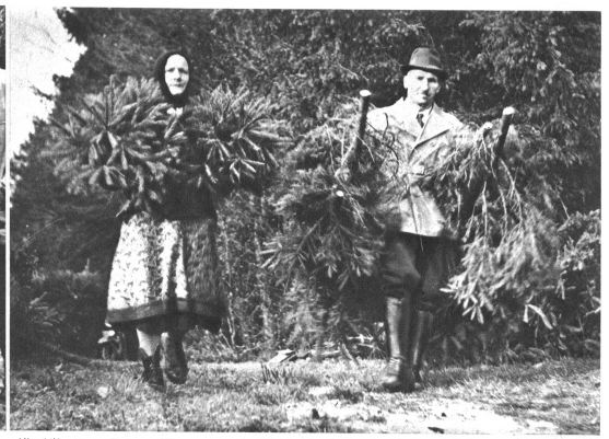
Alles hilft mit, um die jungen Baumchen aus dem Wald zu tragen