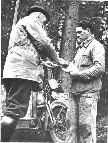
Zahlen ist wichtig — der Förster schreibt eine kleine Rechnung und der Händler bezahlt bar

Jedes Jahr wiederholt es sich neu: erst merken wir kaum, dass es Weihnachten zugeht. Blatt für Blatt fliegt vom Kalender und schon steht ein junges, zartes Bäumchen weniger in 5. Dezember, 8., 15.; endlich beginnt sich so etwas wie ein weihnachtliches Gefühl zu regen und plötzlich, fast mit einem Schlag fühlen wir's: „es weihnachtele!“ Dies ist der Moment, wo wir die ersten Christbaummärkte begegnen, die Strassen so herrlich, fast möchte ich sagen festlich dekoriert. Was es aber an Arbeit und Mühe kostet, bis diese alljährlich nur einmal angebotene Ware verkaufsbereit hier in der Stadt steht, weiss kaum einer. Frühmorgens folge ich dem Bannwart in den dunklen Forst. An einem vereinbarten Ort treffen wir, in diesem frühen Morgenlicht kaum erkennbar, einige Bauern, die heute ihre Tanne schneiden wollen. Seit Jahren schon besorgen sie die Christbaummärkte an der Bundesgasse. Unter ihnen ein junger Handwerker, der gleich mit dem Seitenwagen angefahren ist. Sein durch die Notlage etwas flauer Geschäftsgang zwingt ihn zu einem Nebenverdienst. Da kommt das Baumgeschäft ganz willkommen. Der Förster weist jedem der Interessenten einen ganz bestimmten Platz an, dort darf er sich die ihm am schönsten scheinenden Bäumchen aussuchen und schlagen. Da hat es gewöhnlich und kleine, junge und alte, dickstämmige und dünnstämmige, fette und magere. Das geübte Auge des erfahrenen Händlers findet bald die gangbarsten Grössen heraus, denn er weiss, was die Leute