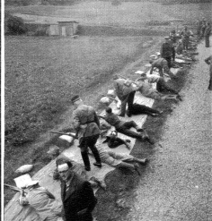
Dass jung und alt gute Schützen sind. Ich sah in einem Berner Schiessstand ergraute Männer, die hervorragende Schiessresultate erzielten.