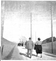
Dass nach mühsamen und arbeitsreichen Wochentagen müde Menschen am Sonntag spazieren und wandern gehen — schwer beladen, im Schweiße ihres Angesichts statt irgendwo am Waldrand zu faulenzeln.