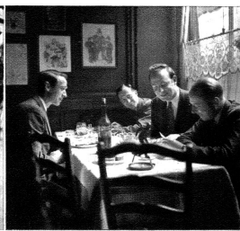
Dass man nirgends in Europa so gut essen kann, wie in den Gaststätten der Schweiz.