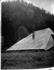
Unverstädlich sind mir die vielen Blechdächer im Lande herum, wenigstens müsste man diese mit brauner Farbe bestreichen.