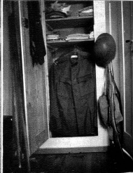
Dass es mich als Bürger von Chicago recht komisch anmutet, dass ein junger Bürger in der Schweiz, jeder Weisfähige, sein Gewehr daheim aufbewahren darf.