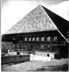
Dass es im Kanton Bern herrliche Bauernhöfe gibt, wie sie nirgends in der Welt zu treffen sind.