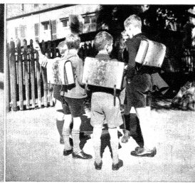
Dass sich die Schüler in der Schweiz auf der Strasse bedeutend disziplinierter benehmen, als bei uns z. B. die New Yorker Buben. Komisch für einen Amerikaner sind ihre Schulsäcke, die man in keinem Staate der USA antrifft.