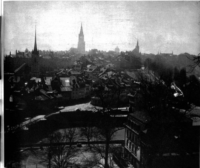
Dass Bern viel besser verdunkelt ist als London, aber er vermisst überall bei Treppen, Laubeneingängen, Eckpfelern und Trottoirrändern den nötigen weissen Anstrich.