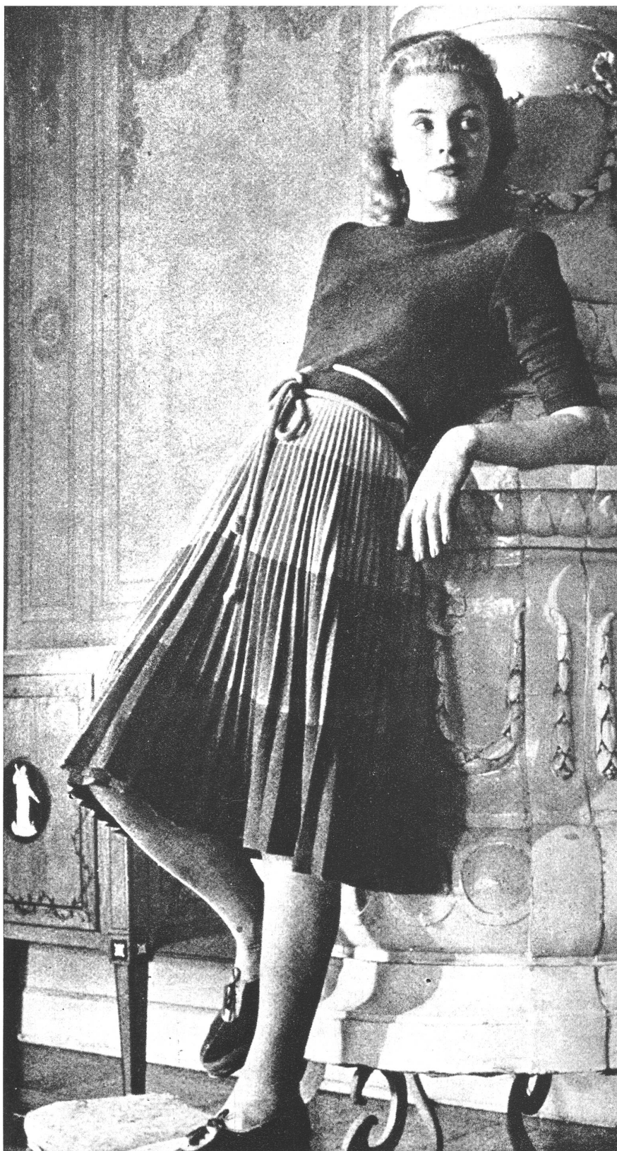
Ein schönes Wollkleidmodell, dessen Oberteil glatt gehalten und der Rock plissiert ist. Die Farbennüancierung ist, entsprechend der Farbe in der Taille, licht und geht in den dunklen Ton gegen unten über. Eine geschmackvolle Kordel schliesst das Kleid nett und gefällig in der Taille ab.