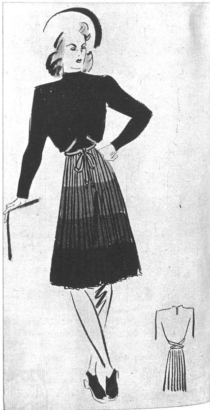
Croquis des Wollkleidmodells mit Nüancierung und entsprechender Rückenpartie. Die Farbe ist braun, die Schattierung von der Taille ab hellbraun, das sukzessive ins Dunkelbraun übergeht.