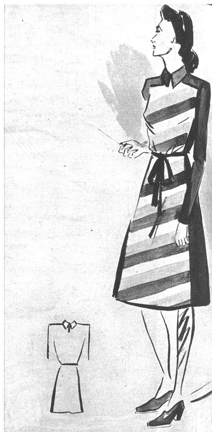
Blaufarbenes Wollkleid mit eingesetztem Vorderteil, das im Muster schräg gehalten ist. Das Kleid ist hoch geschlossen, und trotzdem es einen ernsten Unterton zeigt, ist es nicht streng, sondern leicht und schick.