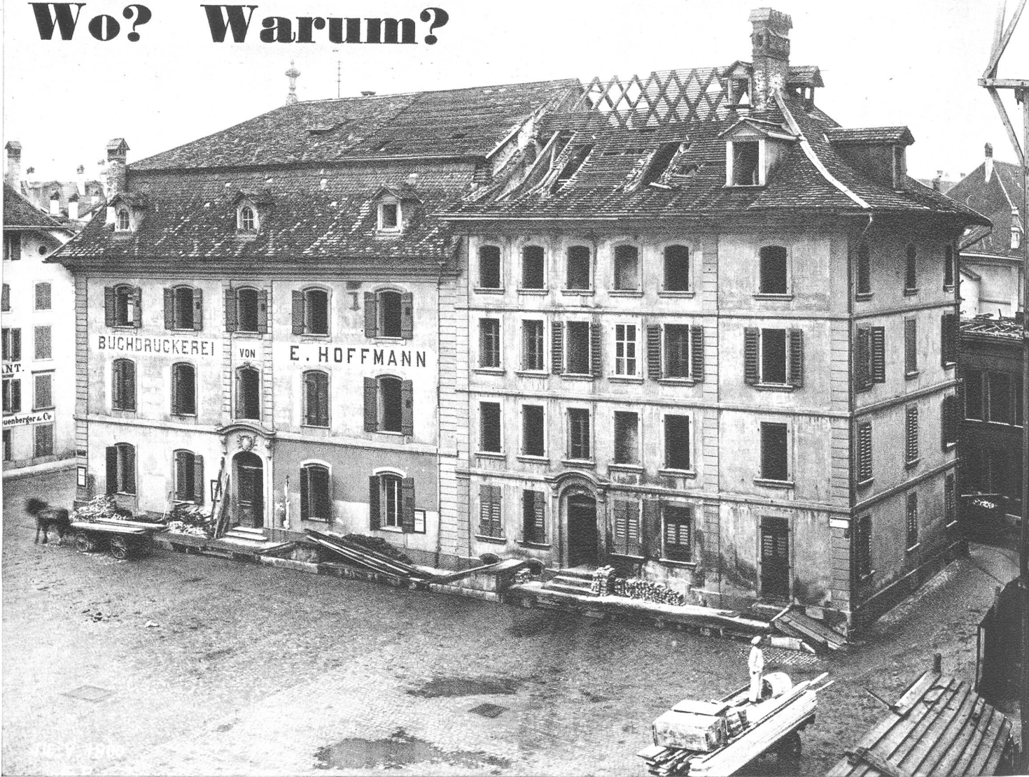
Wo stand dieses Haus in Bern?