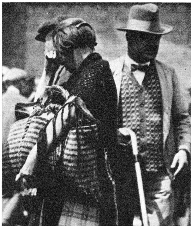
uernfamilien in den Grenzgebieten haben das Schicksal am härtesten zu er- agen.