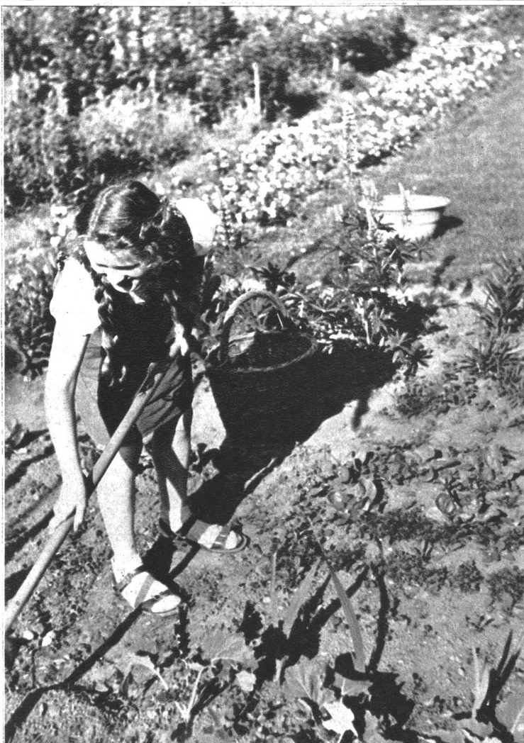
Mit Eifer wird das Eigengärtchen zurechtgemacht! Ob der Eifer auch bis zuletzt anhält? Leider nicht immer. Aber nur die ausdauernde kleine Gärtnerin erntet 100%! — Im Hintergrund der mit Stiefmütterchen gesäumte Rasen, auf dem wir unter fröhlichem Geplauder unser Zvierl einnehmen.