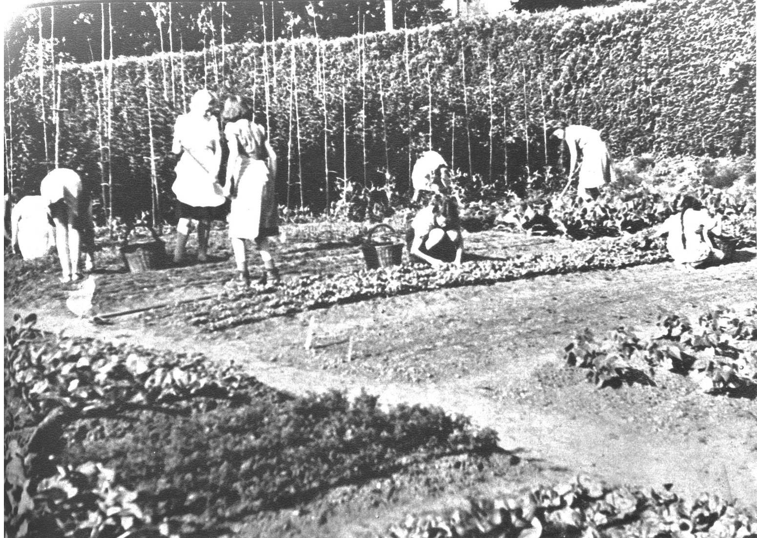
Alles ist eifrig beim Jäten, denn unser Garten soll auch immer fein ordentlich und sauber aussehen.

Im Ablauf des Bächleins wachsen Schilf und gelbe Schwertlilien zwischen den Himbeerhecken. Die Giesskanne musste dort in Sicherheit gebracht werden, weil sie einen Rest Düngerlösung oder Schädlingsbekämpfungsmittel enthält, die den Kindern nicht ohne Instruktion in die Hände fallen darf.