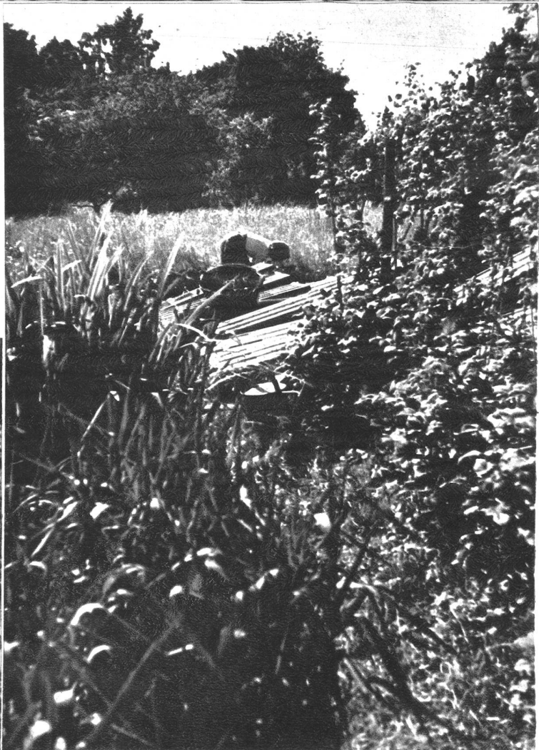
Alles keimt und gedeiht freudig, auch das Unkraut, dem tapfer zu Leibe gerückt wird.

Im Ablauf des Bächleins wachsen Schilf und gelbe Schwertlilien zwischen den Himbeerhecken. Die Giesskanne musste dort in Sicherheit gebracht werden, weil sie einen Rest Düngerlösung oder Schädlingsbekämpfungsmittel enthält, die den Kindern nicht ohne Instruktion in die Hände fallen darf.