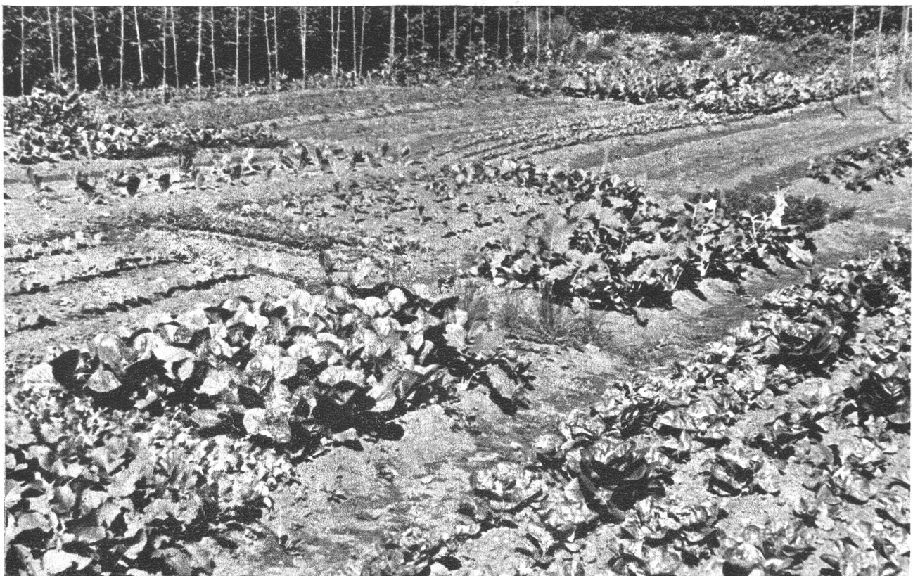
„Im wunderschönen Monat Maien“ sind alle Gemüsearten zart und frisch und es ist eine Freude, das kräftige Wachstum zu beobachten.