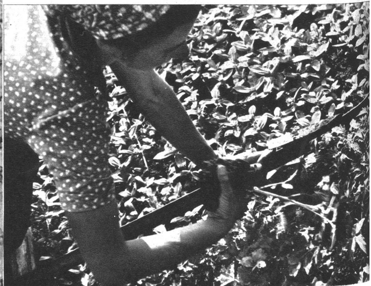
Mit gutem Wurzelballen macht die Gärtnerin den Tomatensetzling zur Pflanzung bereit.