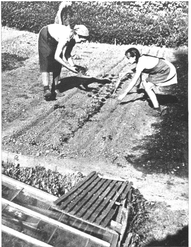
Reihen und Pflanzlöcher sind im Beet genau abgemessen und werden nun mit Sorgfalt bepflanzt. Für kurze Kinderarme ist die Arbeit in der Mittelreihe oftmals ein kleines turnerisches Kunststück.