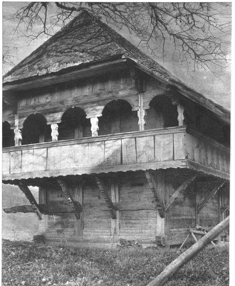
Prächtiger Speicher bei Dürrenroth mit schön geschwungenen Laubenbögen. Die Laube selbst ist mit Schrägbalken abgestützt und zeigt noch die einfache Form, ohne Ausschnitte.