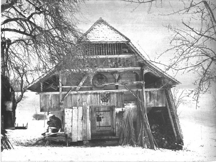
Ein Speicher in Wyssbach bei Madiswil aus dem Jahre 1712. Eine Besonderheit bildet hier die abgeschlossene obere Laube mit den schönen gedrehten Pfosten, das schöne Schloss und die Beschläge an der unteren Türe sowie die wappenartige Verzierung über dem Eingang.