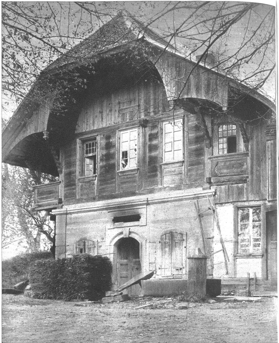
Käserhaus bei Kleindietwil, ehemals eine Käserei, jetzt Stöckli.