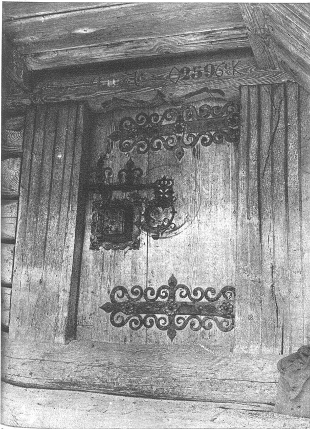
Reich verzierte Beschläge und prachtvolles Schloss an einem Speicher bei Huttwil geben einen Begriff von der Hablichkeit des Erbauers im Jahre 1706, zeigen aber ebensowohl die hohe Kunstfertigkeit des Schmiedehandwerks jener Zeit.