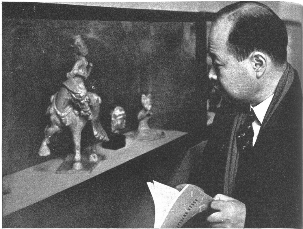
Der japanische Gesandte in Bern, Excellenz Mitani, bei der Betrachtung chinesischer Kunstgegenstände. In der Vitrine die Figur „Pferd mit Reiterin“, eine chinesische Kleinplastik aus gebranntem Ton mit gelber Glasur.

In Anwesenheit zahlreicher Persönlichkeiten des bernischen Kunstlebens und verschiedener Vertreter des diplomatischen Corps wurde in der Berner Kunsthalle eine in diesem Ausmaß erstmalige Ausstellung über Asiatische Kunst eröffnet. Es handelt sich um eine Schau asiatischer Kunstwerke, die sich in schweizerischem Besitz befinden. Die einzigartige Ausstellung legt Zeugnis ab von dem Interesse, das dieser fremdländischen Kunstart in unserem Lande entgegengebracht wird. Die gezeigten Kunstwerke, von teilweise höchstem Seltenheitswert sowohl in künstlerischer als auch in historischer Beziehung, fesseln durch den uns fernen, verinnerlichten seelischen Gehalt, den sie ausdrücken. Es ist eine Ausstellung, wie sie in dieser Vielgestaltigkeit wohl nicht leicht wieder zusammenkommen dürfte.