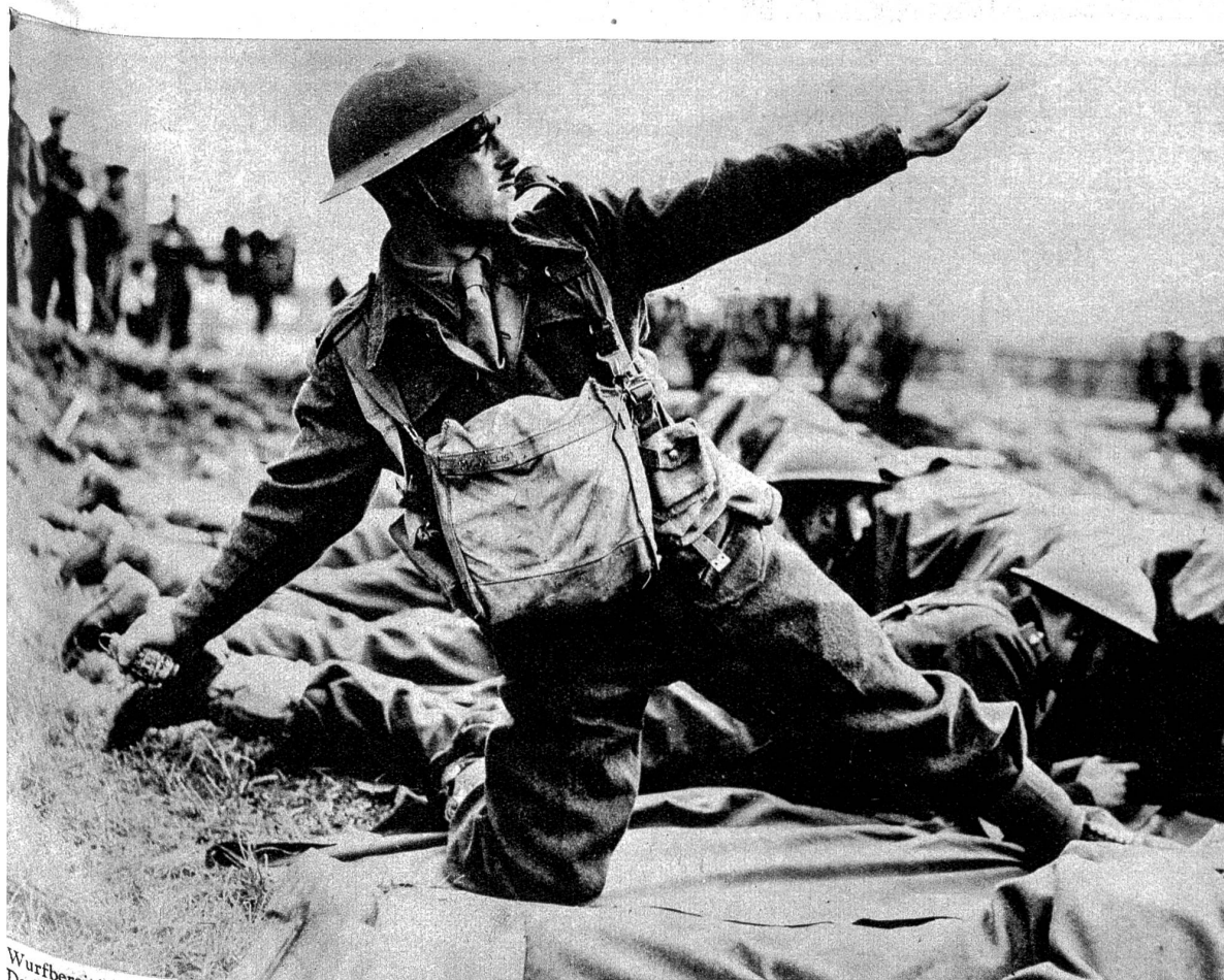
Wurfbereit! Bild aus einem Uebungslager in England. Unterricht im Handgranatenwerfen aus liegender Stellung hinter Deckung — eine der wichtigsten modernen Kampfmethoden.