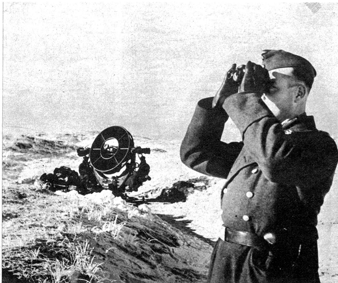
Das in den Sanddünen der Kanal- küste versteckte Horchgerät mel- det einen Flieger schon lange be- vor man ihn mit bloßem Auge erkennen kann. — Ist es Freund oder Feind?