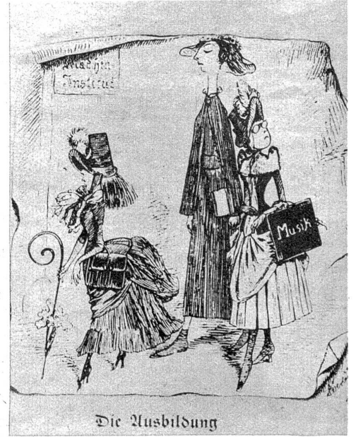
Bild links: Die Mutter steckt im Feuer der Inspiration, das Kind im Wasser des Badezubers. Zeichnung von Honoré Daumier — Mitte Wie sich die Blaustrümpfe eine Doktorpromotion der Zukunft vorstellten. Amerikanische Karikatur, 1897. — Bild rechts: Die Ausbildung: Sie widmen sich fanatisch ihrer Bildung. Aus alten „Fliegenden Blättern.“