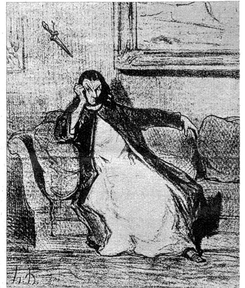
Bild rechts: Der dramatische Blaustrumpf: „Ausgepiffen . . . ausgepiffen . . . ausgepiffen . . .!“ Zeichnung von Honoré Daumier. — Unten links: Der lyrische Blaustrumpf: Im bleichen Mondlicht sucht sie Erleuchtung. Zeichnung von Honoré Daumier. — Unten rechts: Der politische Blaustrumpf: Die Politik hat sie verschlungen. Stich von Bosio.