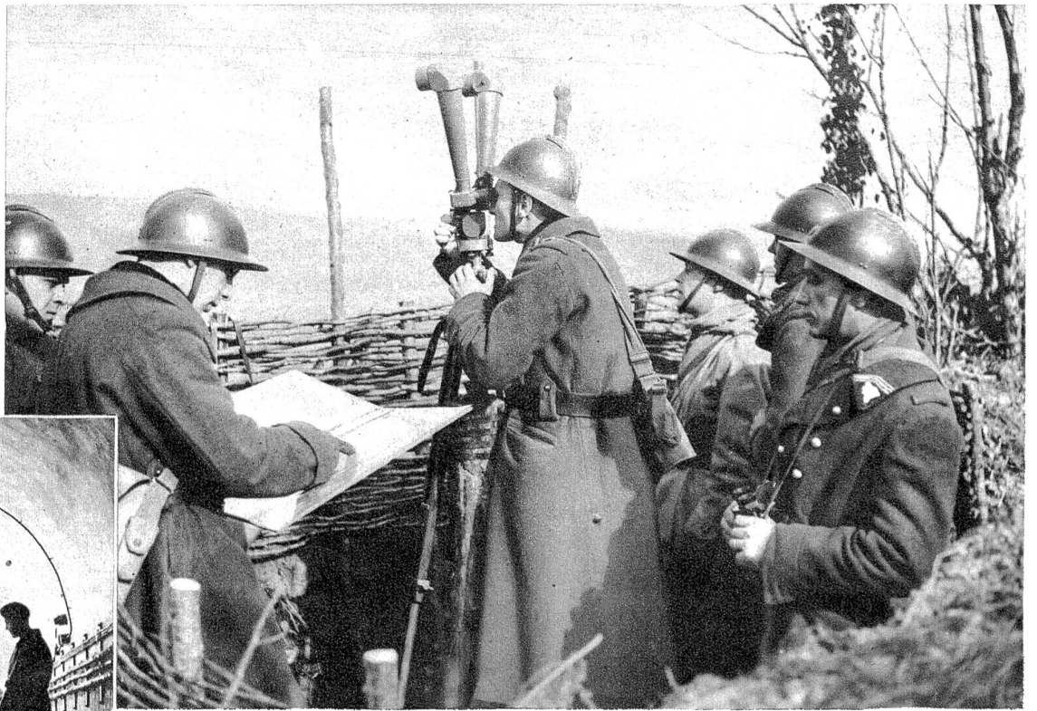
Französischer Artilleriebeobachtungsstand während der Gefechtstätigkeit.