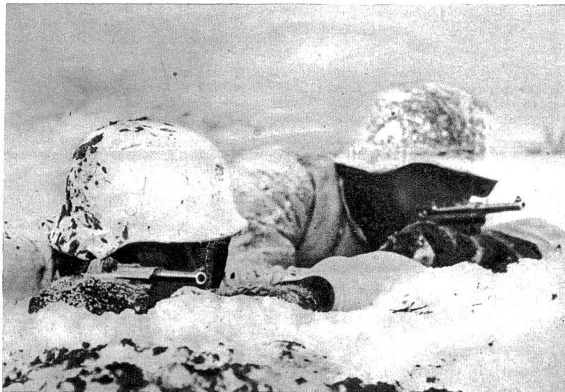
Gute Tarnung im verschneiten Gelände.