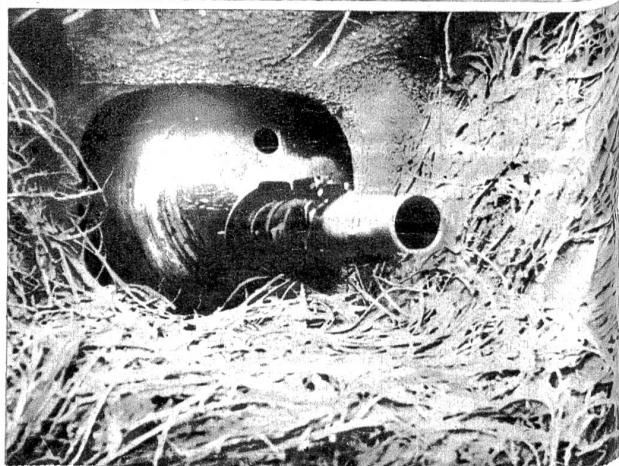
Das Auge des Bunkers. Maschinengewehr in einer getarnten Panzerkuppel.

Eigenartige Tarnung eines englischen „Scharfschützen“, der sein Gewehr mit weissen Tuchstreifen umwunden und den Verschluss mit Schnee bedeckt hat. „Ein Sniper (Mann, der aus grosser Entfernung zielschiess) beim Zielen“, so lautet der Text zu dieser Amtlichen britischen Photo des Kriegsministeriums. Ob man wohl mit überdecktem Visier auch zielen und mit verschneitem Verschluss auch laden kann? Vielleicht im Kriegsministerium in England.