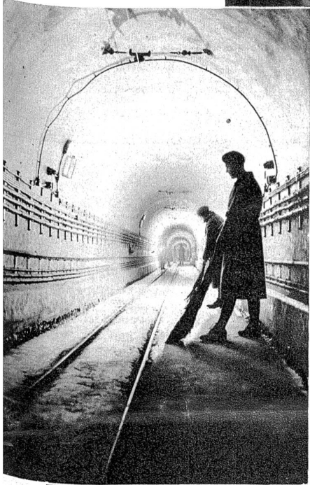
Grosser Verbindungsstollen in der Maginot-Linie. Die einzelnen Festungswerke sind durch solche bombensichere Verbindungsgänge tief unter der Erde miteinander in Zusammenhang. Durch diese Stollen können auf schnellstem Wege mittels elektrischer Bahnen Mannschafts-, Munitions- und Materialtransporte vorgenommen werden.