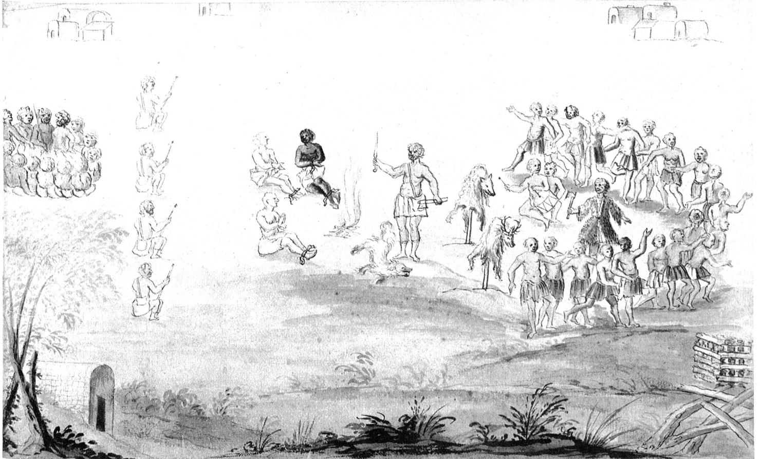
Christoph von Graffenried als Gefangener bei den Indianern, eine Zeichnung, die von ihm selbst gemacht worden ist. In der Mitte er selbst mit dem Feldmesser Lawson und seinem Neger gefesselt am Boden sitzend. Rechts vor ihm der Henker, zu dessen Füßen ein toter Wolf und auf Stangen das Fell eines Wolfes und dasjenige eines Hirsches. Weiter rechts die Indianer, Frauen und Männer, die zum Klange einer Trommel um ihren Zauberer oder „Medizinmann“ den Kriegstanz tanzen. Rechts im Vordergrund der Scheiterhaufen, auf welchem Lawson verbrannt wurde. Links der Kreis der beratenden Krieger um ihren Häuptling geschart; zwischen ihnen und den Gefangenen vier Krieger, die mit ihren Gewehren die Gefangenen bewachen. Im Hintergrund und vorne links Indianerhütten, in ihrer charakteristischen, von Graffenried genau beschriebenen Bauart. Es ist dies eine der äusserst seltenen Zeichnungen ursprünglicher indianischer Kriegs- und Gerichtsbräuche, gezeichnet von einem, der wirklich „dabei gewesen ist“ und nur wie durch ein Wunder dem fast sicheren Tode entrann. So unbeholfen diese Zeichnung Christoph von Graffenrieds auch ist, so bildet sie doch ein unschätzbares Dokument für die Kenntnis indianischer Sitten.