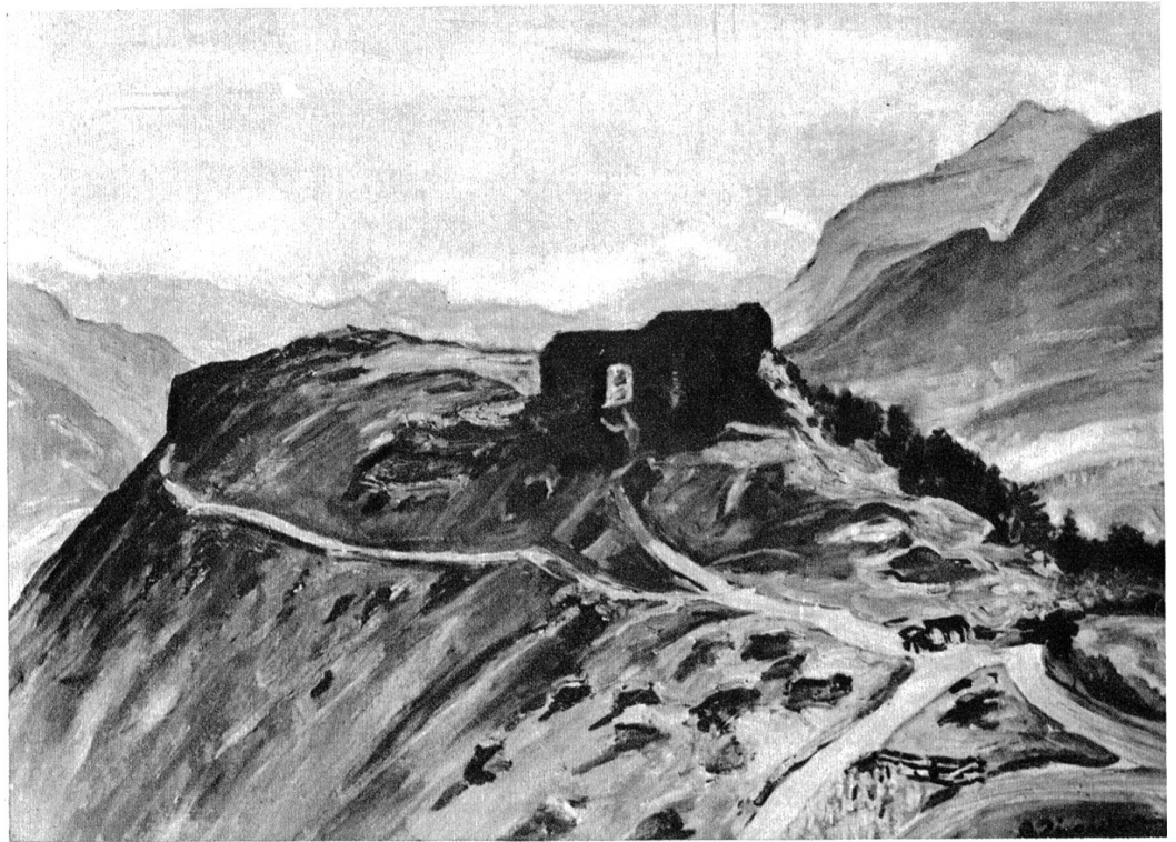
Burgruine im Wallis