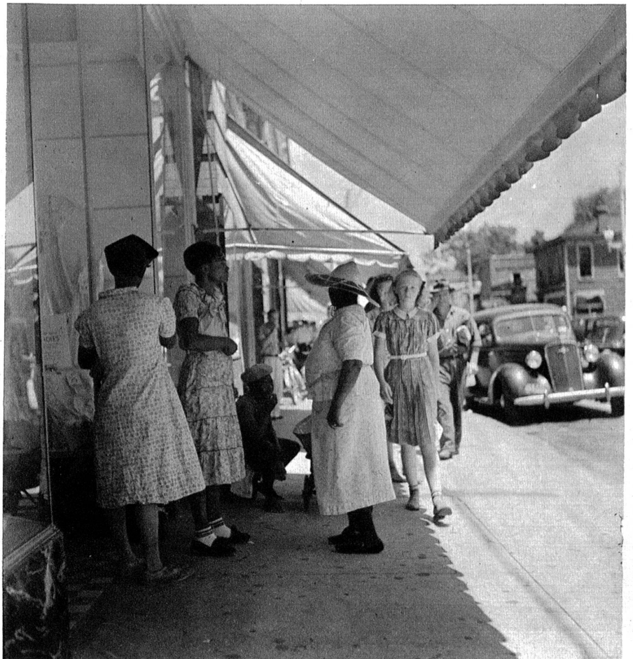
Eine Strasse im Geschäftsviertel von New Bern.

Dieses Bernbanner bildet noch heute das pietätvoll bewahrte und verehrte Symbol der Stadt. Vor ihm wird der Amtseid geschworen: „Auf unsere Stadt und unser Banner“. Es wird als das Zeichen liebevoller Verbindung zwischen dem Bern des glücklichen, freien und stolzen Amerika und seiner prächtigen Mutterstadt in der Schweiz hoch in Ehren gehalten.