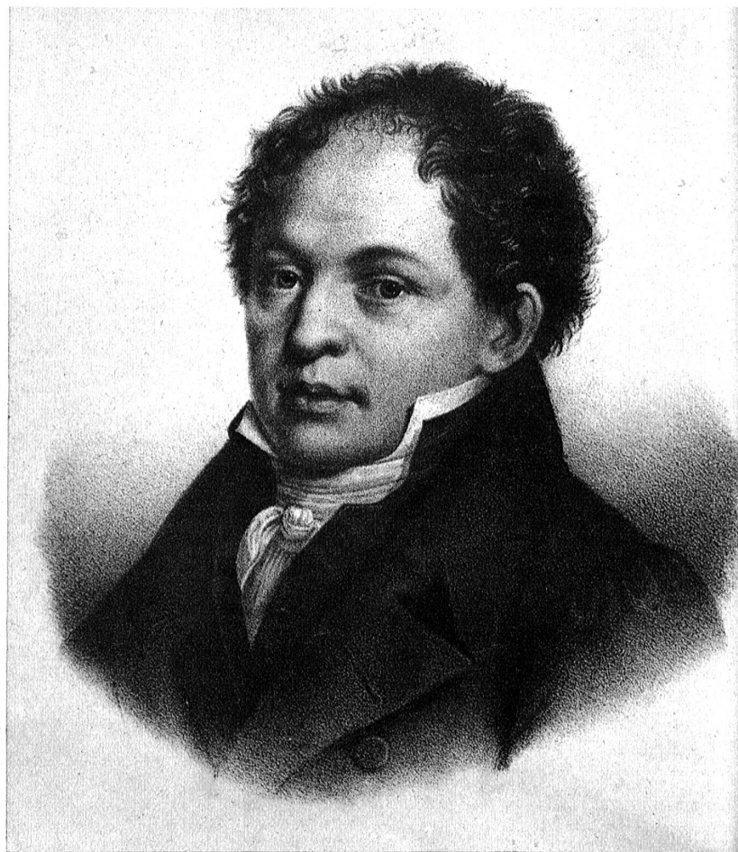
Das Portrait des Dichters unserer Nationalhymne, Johann Rudolf Wyss (1781—1830). Lithographie von Hasler.

In diesem Bändchen: „Kriegslieder. Gesammelt zur Erholung, für das Artillerie-Camp im Sommer 1811“ wurde unser „Rufst du mein Vaterland“ erstmals gedruckt. Dieser Erstdruck ist heute eine grosse Rarität und nur noch in einigen wenigen Exemplaren vorhanden. Das Lied war mit „Vaterlandslied für schweizerische Kanonier“ überschrieben.