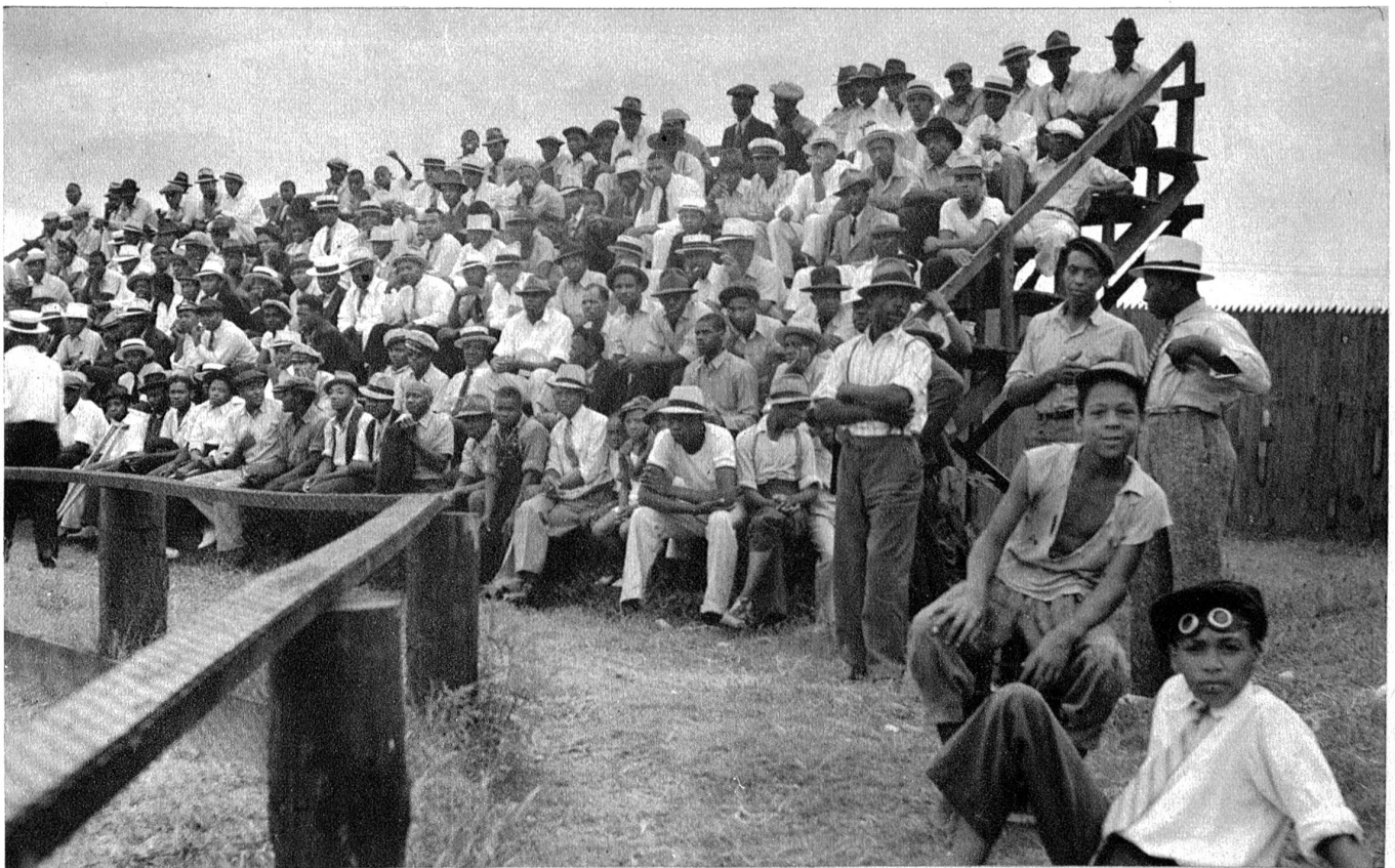
Die heutigen „Eingeborenen“ in New Bern. Die Tribüne der Neger-Berner oder Berner-Neger am Baseball Match. Man merkt, dass sie nicht häufig photographiert werden. Alle sehen gespannt auf den Photographen. Weiss und Schwarz ist in New Bern streng voneinander getrennt. Die Tribüne der Schwarzen liegt weit von derjenigen der Weissen entfernt. Sie ist auch bedeutend weniger komfortabel, doch zahlen beide, Weisse und Schwarze, dasselbe Eintrittsgeld.