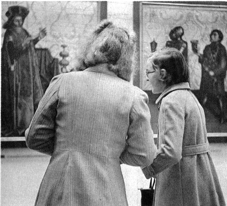
Zwei Mädchen vor Bildern von Konrad Witz aus der Basler Sammlung.