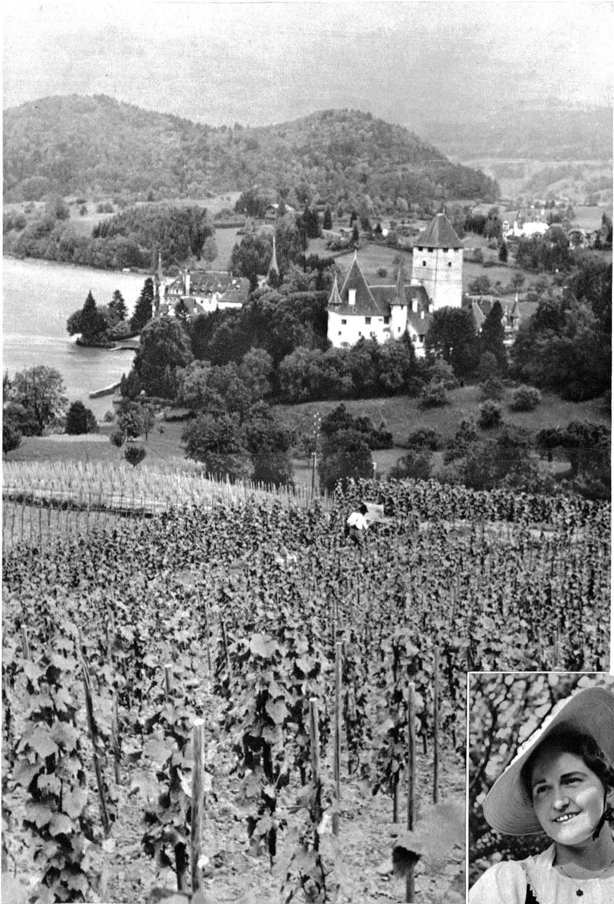
Spiez. Blick vom Rebberg auf das Schloss.