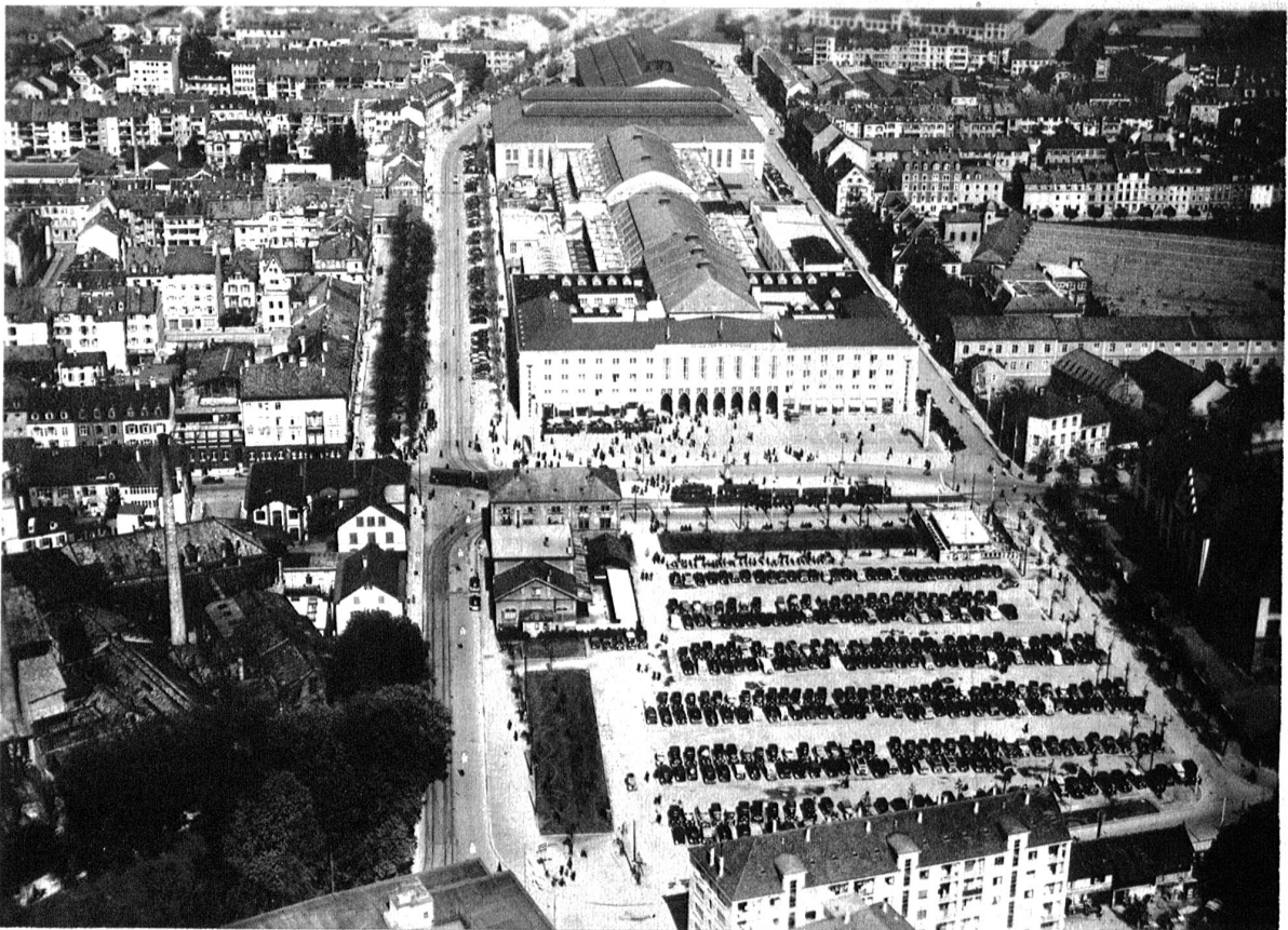
Fliegerbild des Areals der Schweizer Mustermesse in Basel.