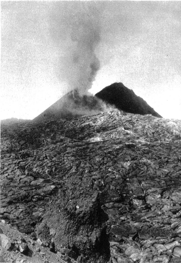
Die Aschenkegel des Vesuv vom äusseren Kraterrand aus.