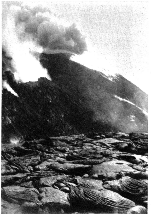
Ein Bild der bizarren Formen der erstarrten Lavamassen in etwa 30 Meter Distanz vom Aschenkegel des Vesuv.