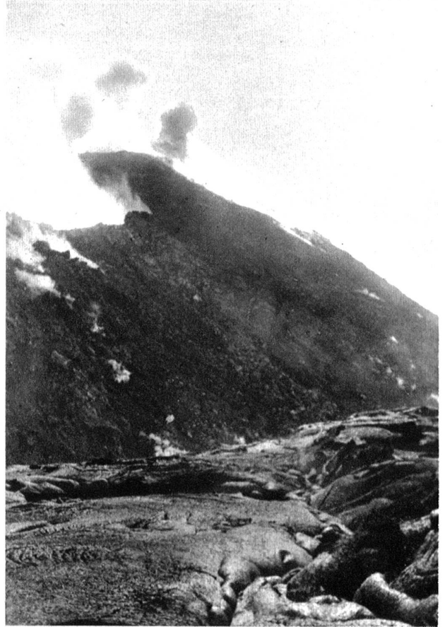
Der immer in Wolken gehüllte Gipfel des Vesuv aus nächster Nähe.