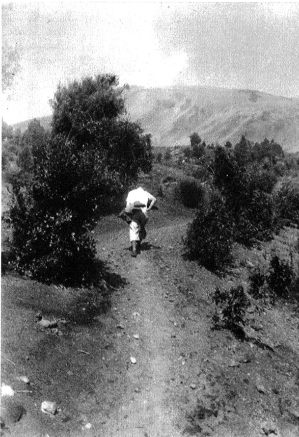
An der obersten Baumgrenze beim Aufstieg zum Vesuv.