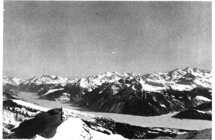
Blick vom Wildhorn ins neblige Rhonetal.