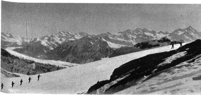
Aufstieg der Patrouillen zum Wildhorn.