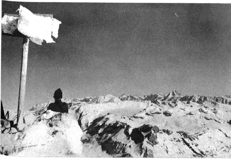
Der Wildhorngipfel mit Aussicht nach dem Wildstrubel.