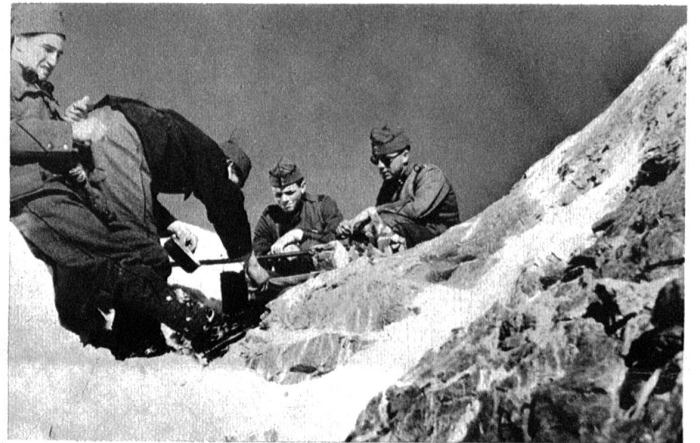
Abkochen am Wildhorngrat auf 3124 Meter über Meer.