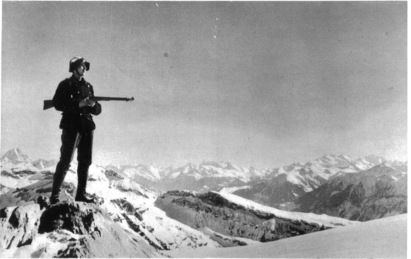
Wache am Wildhorngrat.