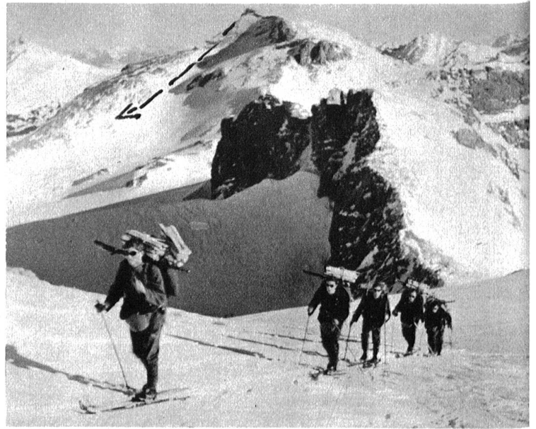
Blick auf das Schneidehorn, von welchem sich die verhängnisvolle Lawine löste, die am 7. März vier Kameraden der Gebirgsbrigade 11 verschüttete.