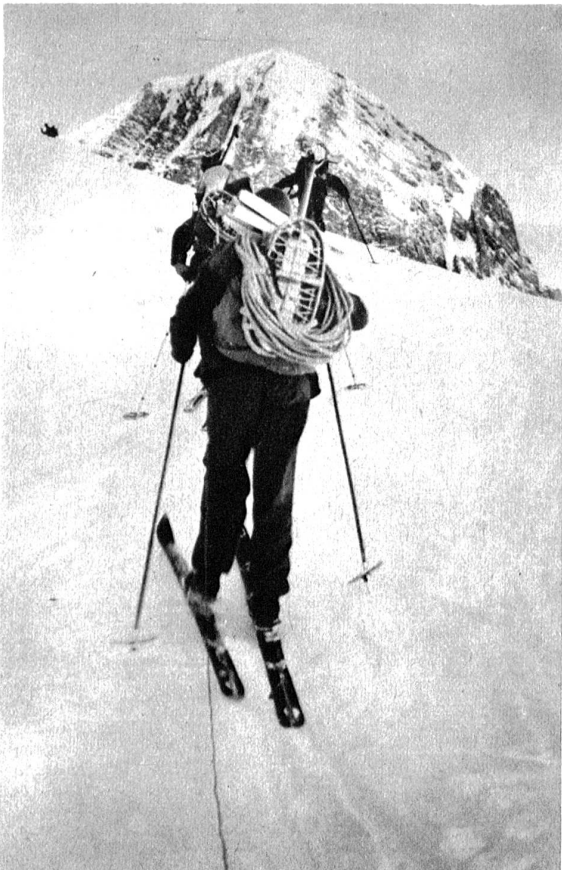
Aufstieg am steilen Kirchli. Als Sicherung ist jeder Mann der Kolonne mit der Lawinschnur ausgerüstet.