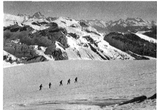
Aufstieg über den Wildhorngletscher.