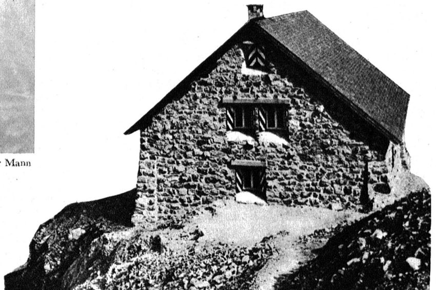
Die Wildhornhütte, in welcher ein Detachment der Geb.-Brigade 11 während des Sturmes blockiert war.