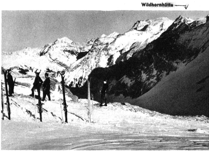
An der Arbeit über der Wildhornhütte.