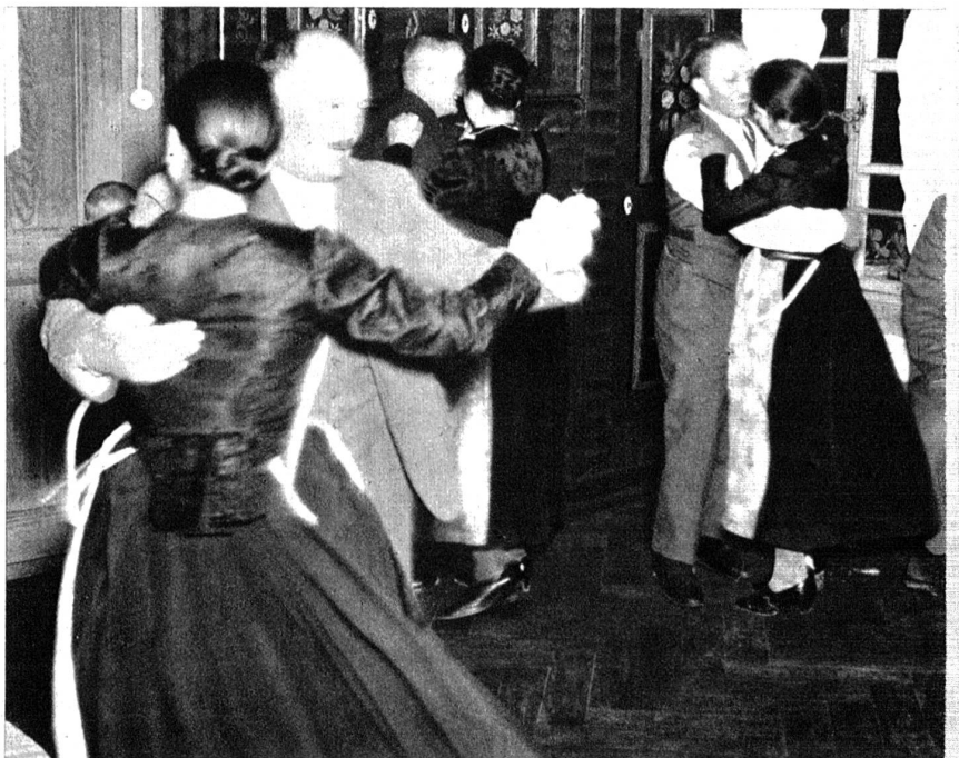
Abends drehte man sich beim Tanze fröhlich im Kreise.