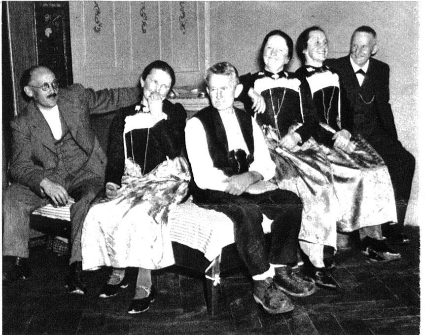
Am Abend sassen der Grossvater und seine Kinder am warmen Ofen in der Stube beisammen.