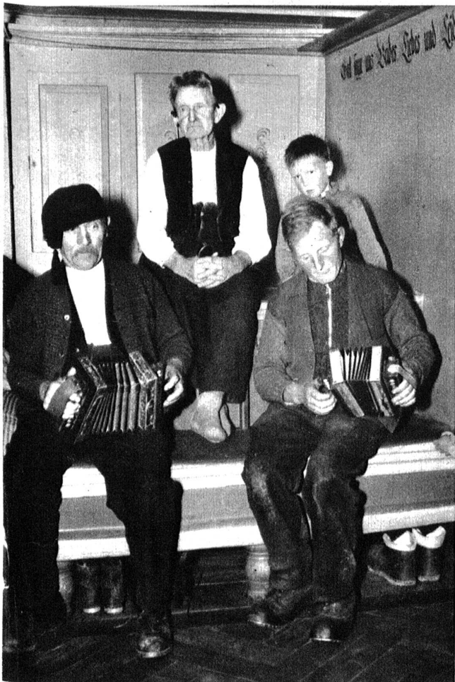
Der Posthans und Liebel, der Meisterknecht vom Lehnhof spielten die Langnauer Härpfli zum Tanze auf.