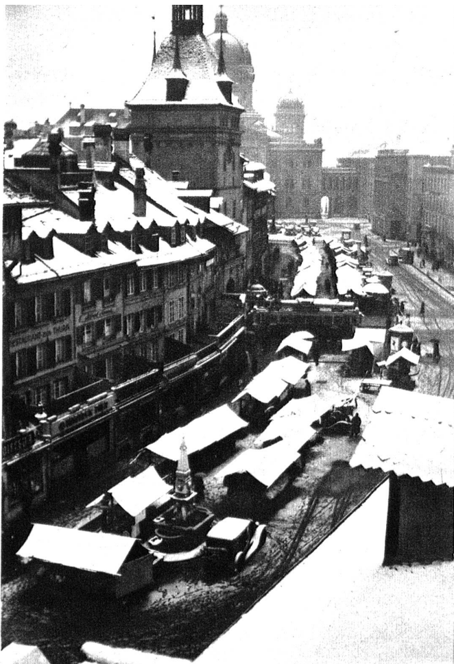
Berner Wintermät auf dem Waisenhaus- und Bärenplatz.