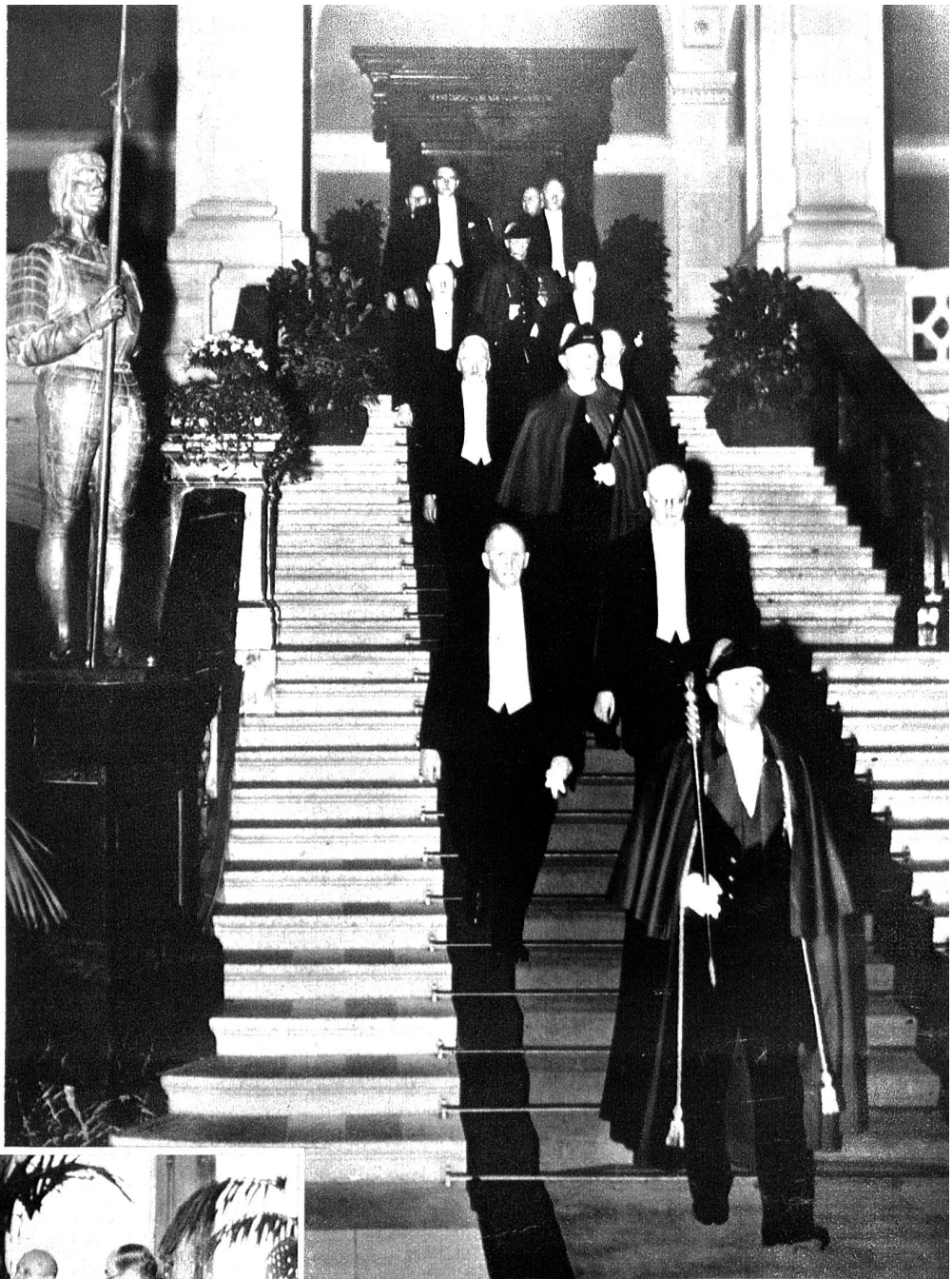
Neujahrsempfang im Bundeshaus. Die ersten Gratulanten sind jeweils traditionsgemäss die Vertreter der bernischen Bürgergemeinde, des Gemeinderates, des Stadtrates, des Regierungsrates und der beiden bernischen Regierungstatthalterämter. Die „Hausherren“ haben also ihr überliefertes Vorrecht. — Wir zeigen die stattliche bernische Delegation mit ihren schmucken Weibern im Treppenaufgang nach der Vorsprache beim Bundespräsidenten.