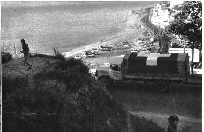
Die Strasse von Barcelona nach der französischen Grenze führt 80 km der Küste des Mitteländischen Meeres entlang. In südlicher Sonne, am Fischerdorf San Pol del Mar wird Halt gemacht. Ueber den Wagen glänzt das Schweizerkreuz. Die Flieger beider Parteien kennen die Kolonne und haben bis heute das weisse Kreuz im roten Feld zu respektieren gewusst. — „Muchas gracias“.