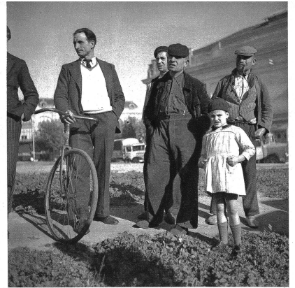
Spanische Flüchtlinge in Perpignan.