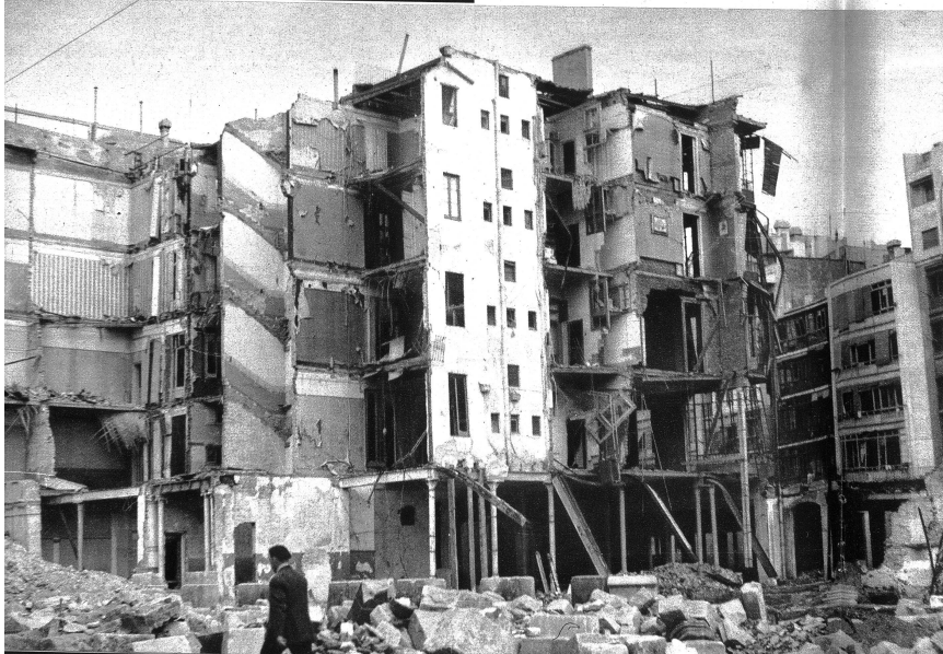
Resultat der gestrigen Bombardierung. Eine 100 kg schwere Zeitbombe sass zu 4000 Meter Höhe in das Haus. Keiner der Bewohner ist dem Tode entronnen. — Wir denken an das Luftschutzmerkblatt in unseren Hausgängen; an Sandstöße und Lössbesen auf dem Estrich!