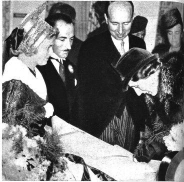
Die schwedische Kronprinzessin in der Ausstellung.