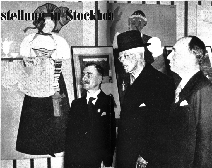
Der 80-jährige König Gustav V. besucht die Schweiz-Ausstellung in Ostermans Marmorhallen in Stockholm. Links vom König Minister Dinichert.