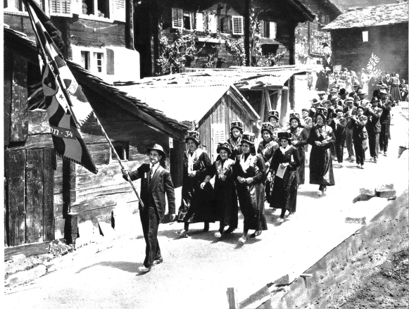
Beide Aufnahmen von Tambour- und Pfeiferfest in Aussersberg.