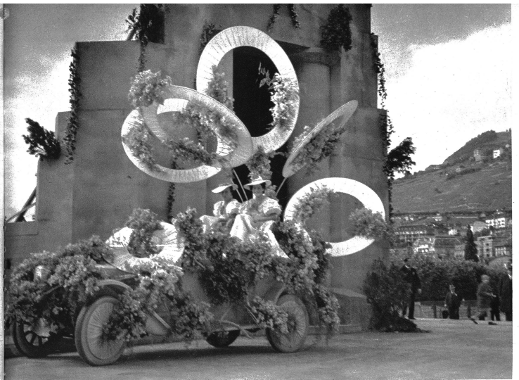
Phantasiewagen mit Blumenringen

Noch selten hat künstlerisches, gärtnerisches Gestalten solche Orgien der Farben, der Blumen und der Freude gefeiert wie in Montreux am Blumenfeste des 20. Märzfestes. Es herrschte da ein Wettstreiten unter den ersten Fleuristen, wie man es leider so selten zu Gesicht bekommt und viele der Wagen waren Brunnfälle in des Wortes besser Bedeutung. Und wir können kaum bessere Worte finden, um diese Schönheit zu schildern, als wenn wir aus dem Festspiel „Hades und Core“ einige Verse des unvergleichlichen Bischoff zitieren, der den Chor also singen läßt: