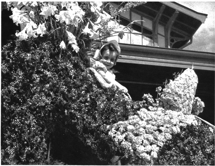
Ein eleganter Damenschuh aus Blumen