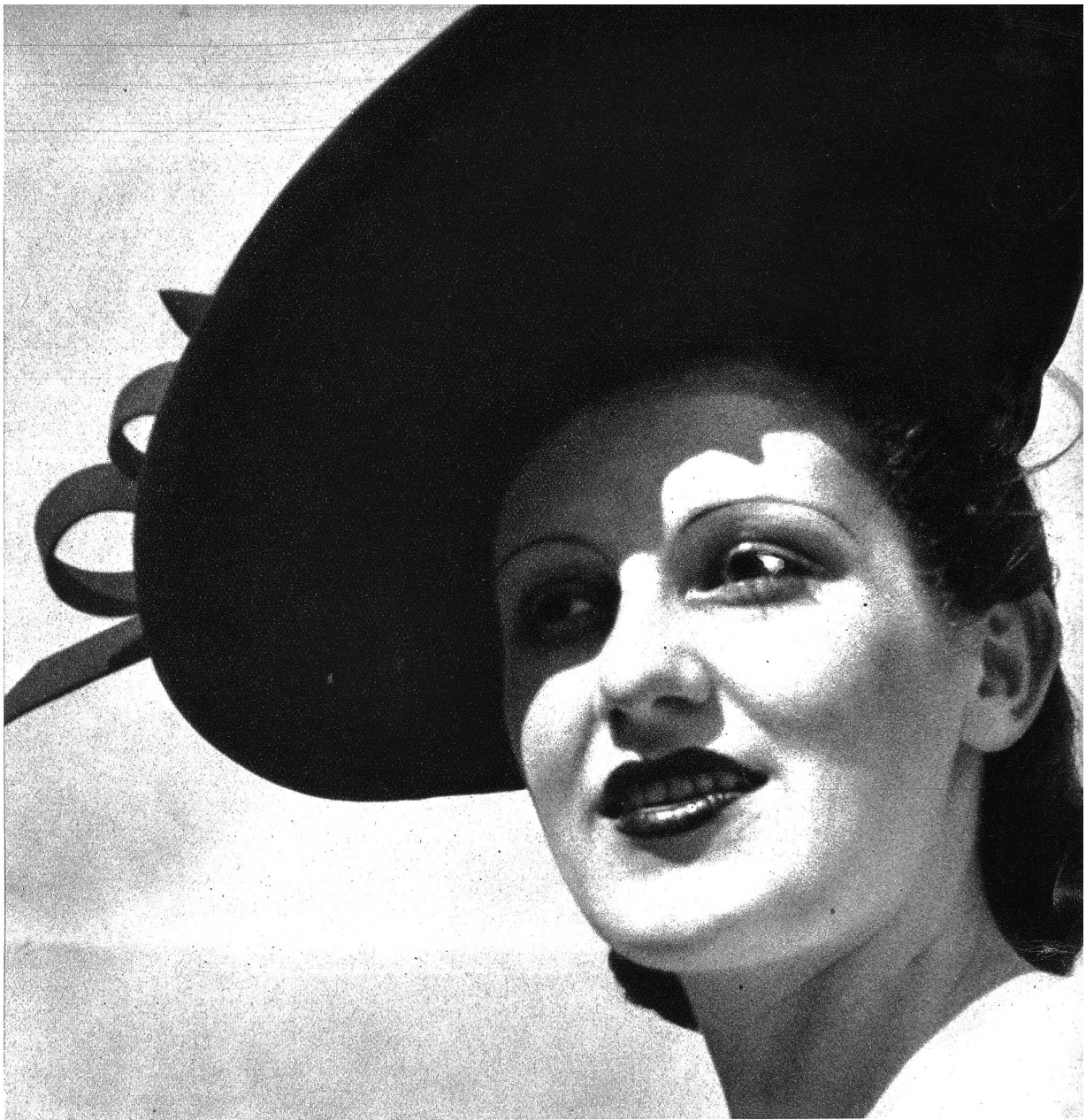
Inspiriert aus Mexiko oder von der „Bayrischen Olm“? Schwarzer breitrandiger Sombbrero mit schlangenförmigem Band.

Paris, in einem großen Café im Montparnasse. Soeben kommen wir zurück vom Prix des Drags, einem der größten Pferderennen Europas, das alljährlich in der Metropole Frankreichs ausgetragen wird. — Wer hat gewonnen, fragt uns ein Berner Maler, der sich wie viele andere Schweizer daheim nach einem kühlen Buchenwalde sehnt. Wir bebauern. Was wir dort hörten, war die Startglocke, was wir sahen, waren nicht die Pferde, sondern „les plus belles femmes de Paris“, ihre Kleider, ihre Gesichter, ihre Augen und all das, was zu einer vrai Parisienne gehört. Am Grand Prix von Paris, am Prix des Drags, werden nicht nur Summen auf die Favoriten des Rennens gesetzt, an diesen Tagen entscheidet sich die Frauenmode der Welt, ob breitrandiger Sombbrero oder Dreifspitz, ob lang oder kurz, ob himmelblau oder weiß mit aufgedruckten Blumen, ob sich die Mode aus Großmutterns glücklichen Zeiten durchsetzt, ob die St. Galler-Spizen wieder zur Blüte gelangen und das wäre unsere leise Hoffnung.