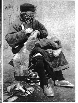
Wandelnder Strassen-Schneider; von Haus zu Haus geht er, fragt nach Flickarbeit, setzt sich an den Strassenrand, macht seine Brille zurecht und verrichtet sein Werk.