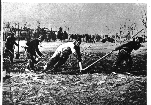
Primitiver Anbau in China, wo noch die äusserst billige menschliche Handarbeit anstatt der Haustiere verwendet wird. Der erste Arbeiter zieht den Pflug, der zweite stösst ihn, der dritte streut das Korn in die Furche, der Vierte streut etwas Dünger aus.